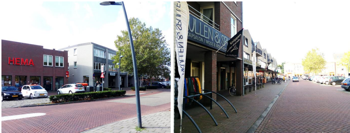
FIGUUR 1 HUIDIG SFEERBEELD ZUIDWAND SINT AGATHAPLEIN BOEKEL