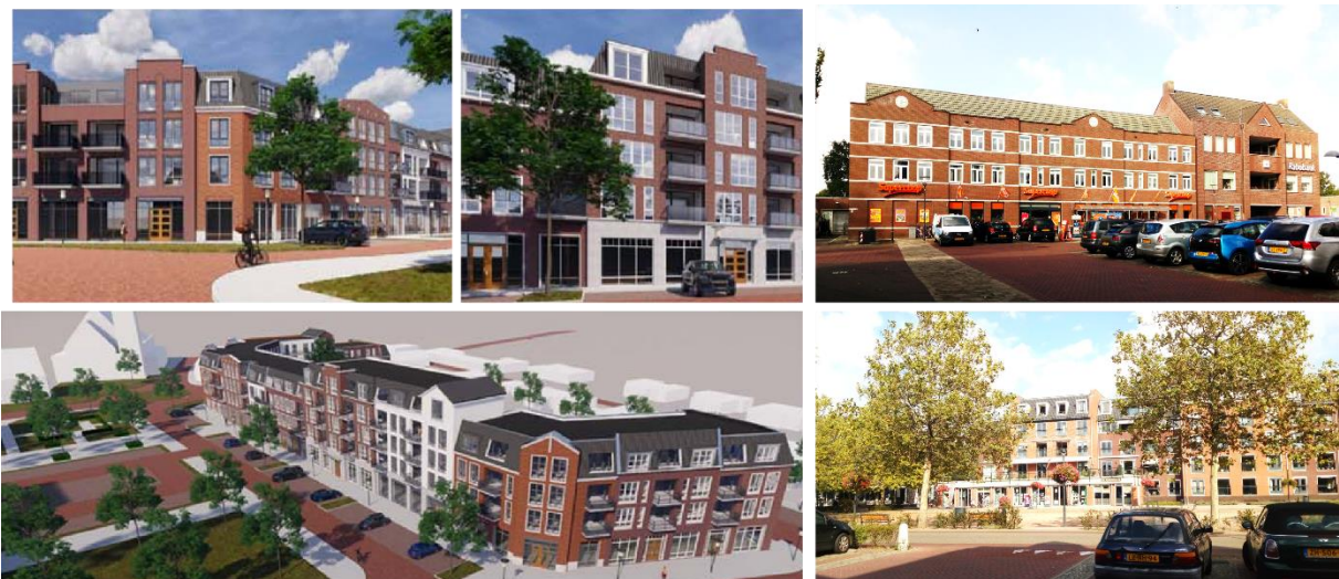
FIGUUR 2 TOEKOMSTIG SFEERBEELD ZUIDWAND SINT AGATHAPLEIN (3 KEER AFBEELDING LINKS) EN UITSTRALING BESTAAND NOORD- EN WESTKANT PLEIN (RECHTS)