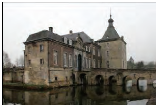
De beide fraaie kastelen Schaloen en Genhoes als onderdeel van het project Buitengoed Geul & Maas

De ruimtelijke begrenzing van Buitengoed Geul&Maas omvat aan de oostkant de kernen Oud-Valkenburg en Schin op Geul. Buitengoed Geul&Maas kent een grote dichtheid aan bijzondere cultuurhistorische monumenten: kastelen, hoeven, watermolens, buitenhuizen. Enkele van deze monumenten liggen in Oud-Valkenburg: de kastelen Schaloen en Genhoes en de watermolen bij kasteel Schaloen. In de gebiedsvisie is