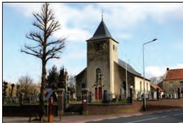
De parochiekerken van Schin op Geul en Oud-Valkenburg