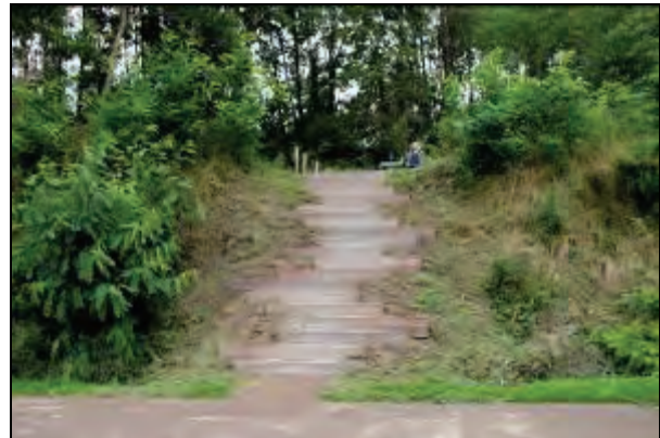
Even uitrusten en genieten van het prachtige uitzicht