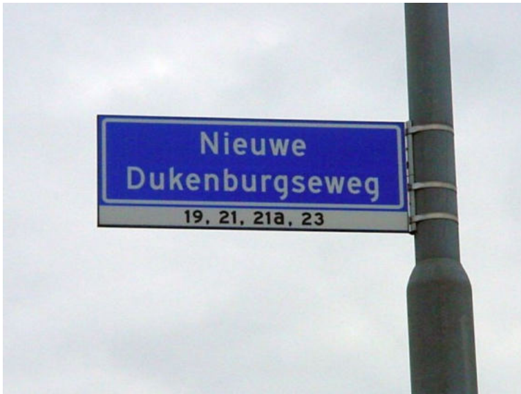
1. Nieuwe Dukenburgseweg; zie kaart