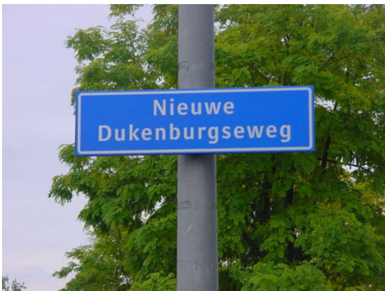
3. zijstraat Nieuwe Dukenburgseweg; zie kaart