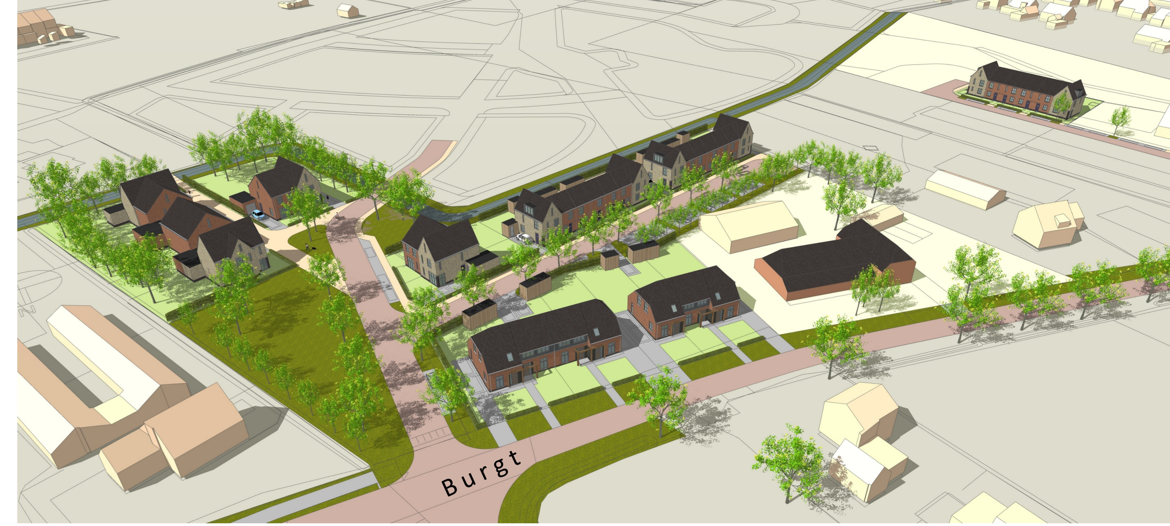
VOGELVLUCHT VANUIT NOORD-OOSTZIJDE