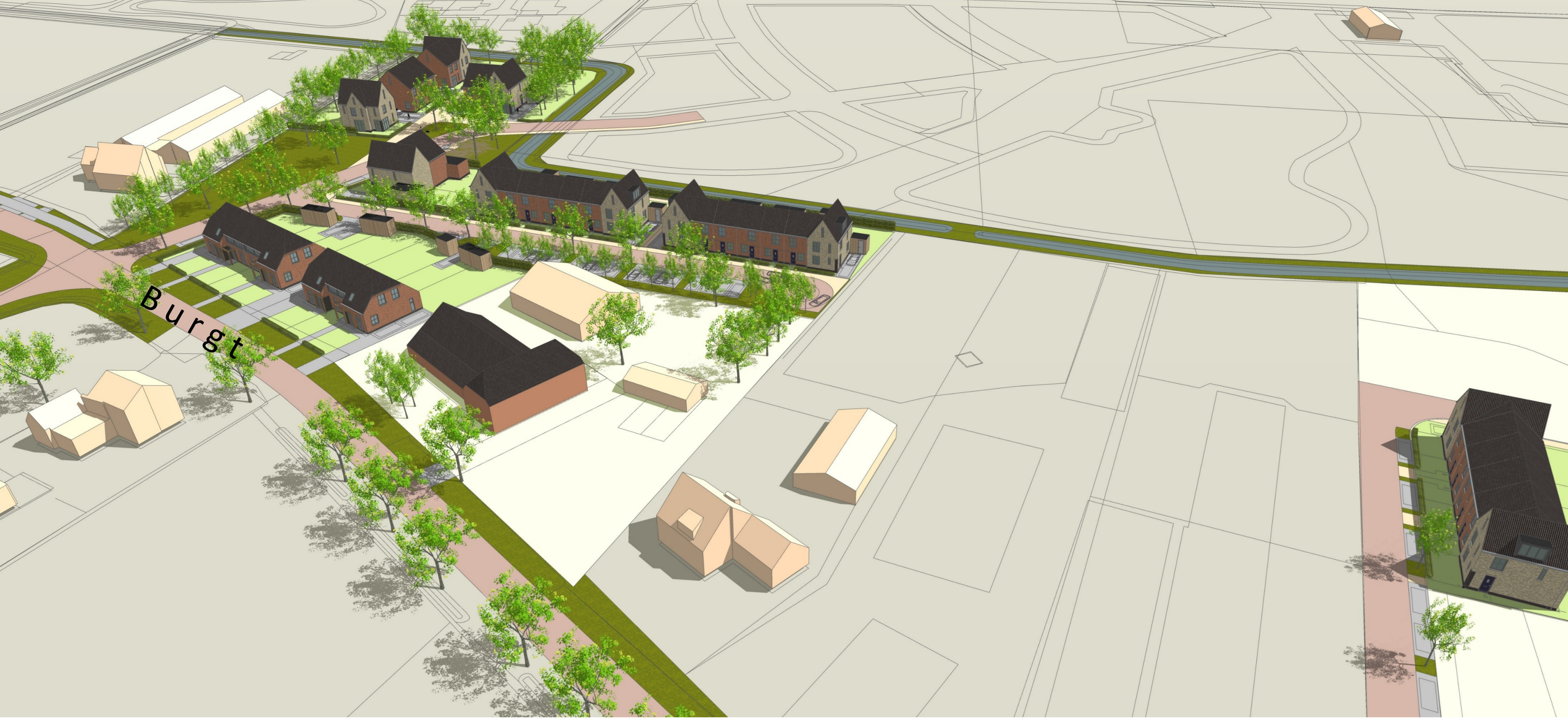
VOGELVLUCHT VANUIT NOORD-WESTZIJDE