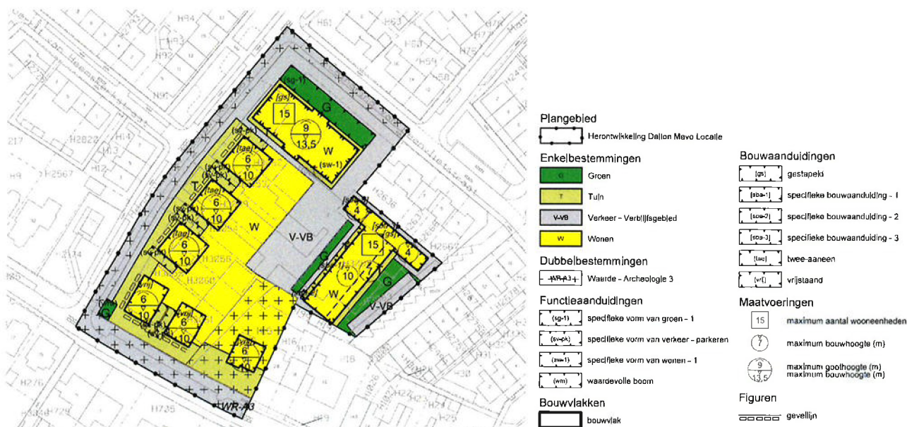
Ontwerp verbeelding Herontwikkeling Dalton Mavo Locatie