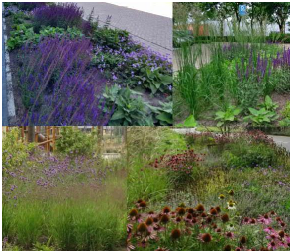
Vaste planten / siergras