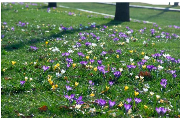
Gazon met bollen