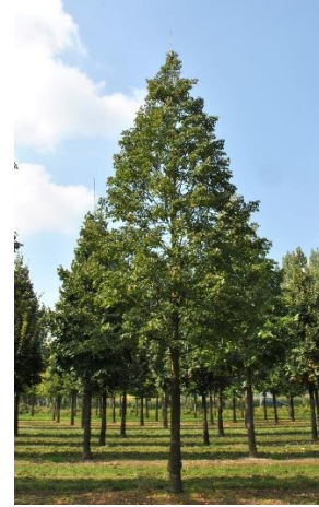
Tilia cordata 'Corinthian'