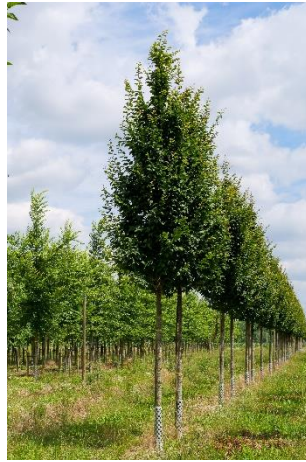
Carpinus betulus 'Lucas'