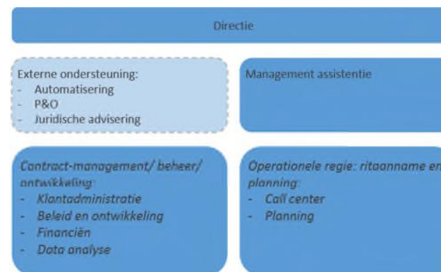
Figuur 3: Schematische weergave organisatiestructuur