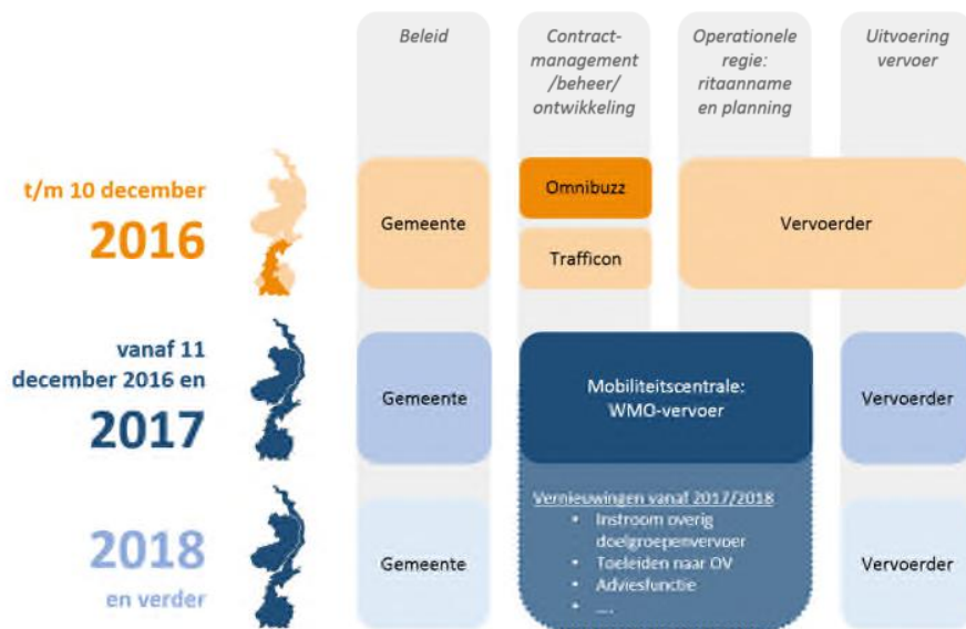
Figuur 2: schematische weergave veranderingen en ontwikkelingen tot 2018 en verder

De wijzigingen ten opzichte van de huidige situatie betreffen met name de mogelijkheid om contractmanagement en operationele regie te combineren binnen één organisatie. Bovendien is er geen regionale versnippering meer. Dit biedt verder mogelijkheden tot vernieuwing die al vanaf 2018 kunnen worden benut.