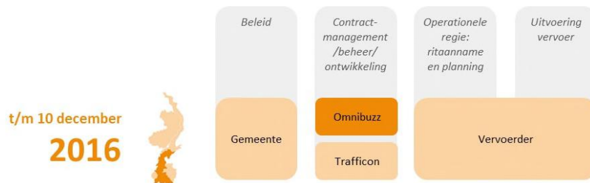
Figuur 1: schematische weergave van het huidige doelgroepenvervoer

Het huidige gemeentelijke doelgroepenvervoer is versnipperd: er zijn veel overheden, opdrachtgevers, bedrijven en vervoerders betrokken. Ook is sprake van veel soorten contracten en is er een groot verschil in werkgebieden.