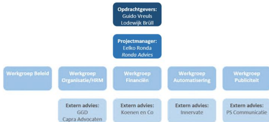
Figuur 5: Projectorganisatie