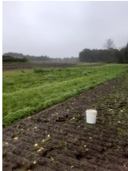
Afbeelding 2 Impressie van het plangebied tijdens het veldwerk: links ter hoogte van boring 4 met blik richting oosten; rechts bij boring 14 met blik naar het zuidoosten