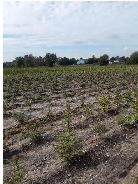
Afbeelding 3 Impressie van het plangebied tijdens het veldwerk: links ter hoogte van boring 23 met blik richting zuiden; rechts bij boring 42 met blik naar het noordwesten