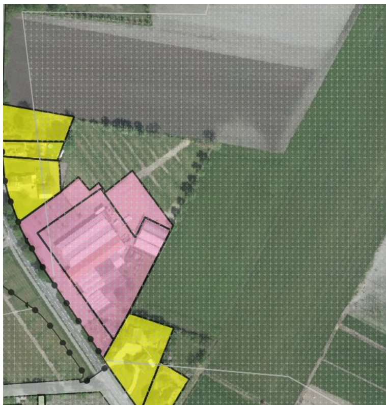
Figuur 1. Verbeelding Gemertseweg 9a, ontwerp Omgevingsplan 2016.