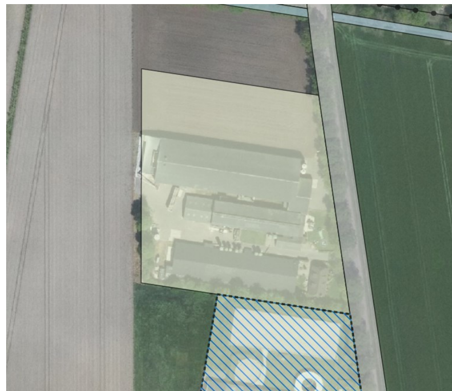
Figuur 4. Verbeelding Voskuilenweg 21 uit ontwerp Omgevingsplan.