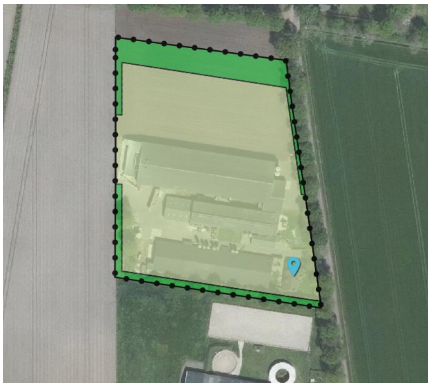
Figuur 3. Verbeelding wijzigingsplan Voskuilenweg 21.