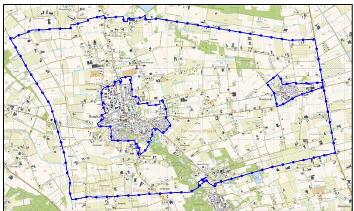
Figuur 1. Besluitgebied Crisis- en herstelwet, bijlage 67.

Op grond van onze aanmelding voor en opname van het plangebied in de 11 e tranche van het besluit Crisis- en herstelwet is uw raad bevoegd om afwijkende regels te stellen in het bestemmingsplan die een verbrede reikwijdte hebben t.o.v. de traditionele onderdelen die in een bestemmingsplan mogen worden geregeld. In de tekst van de relevante passage uit het Besluit 11 e tranche Crisis- en herstelwet staat dat het buitengebied van Boekel opgenomen is. In Figuur 1 ziet u het bijhorende besluitgebied.