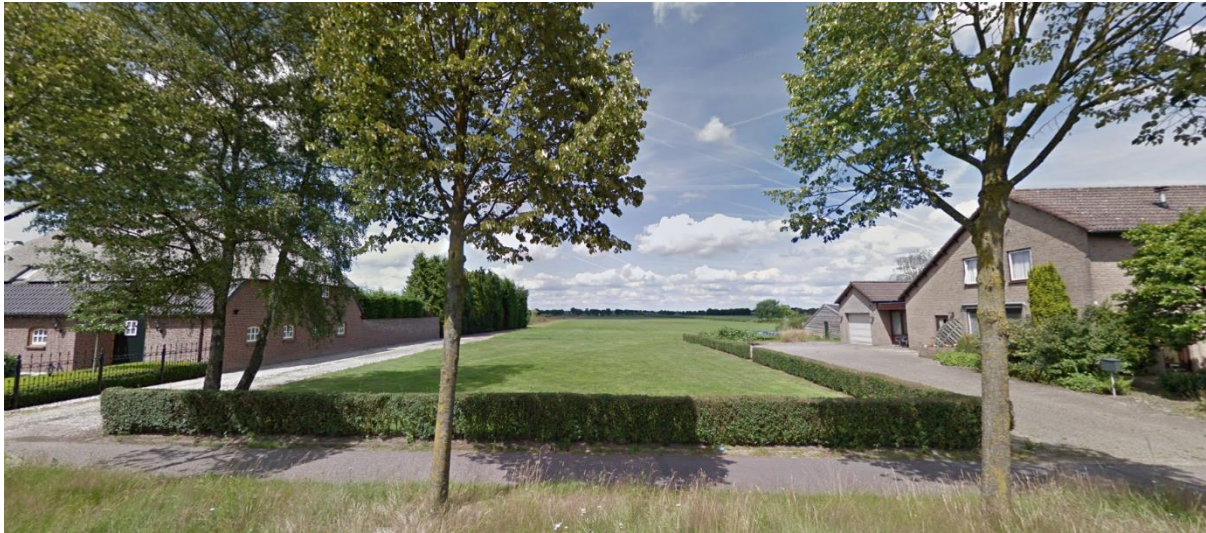
Figuur 4.1: Perceel gezien vanaf straat