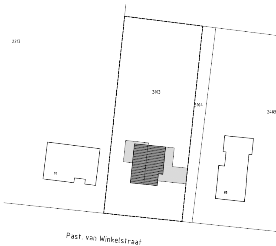
Figuur 2.2: Toekomstige situatie