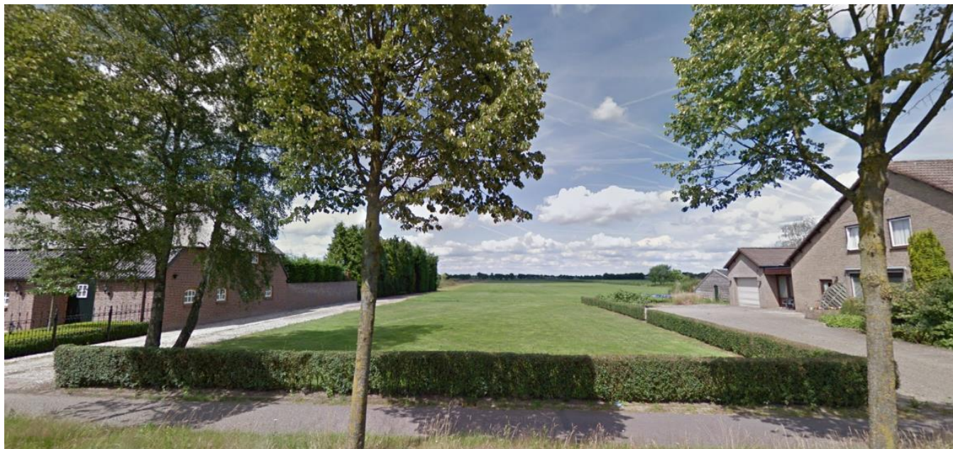
Figuur 2.1: Huidige situatie perceel Pastoor van Winkelstraat ong. (naast nummer 83)

woning en de daarbij horende voorgevelrooilijn. De woning mag een maximale goot- en nokhoogte hebben van respectievelijk 6 en 9 meter. Voor het bijgebouw geldt een maximale goot- en nokhoogte van respectievelijk 3 en 6 meter. Parkeren vindt plaats op eigen terrein.