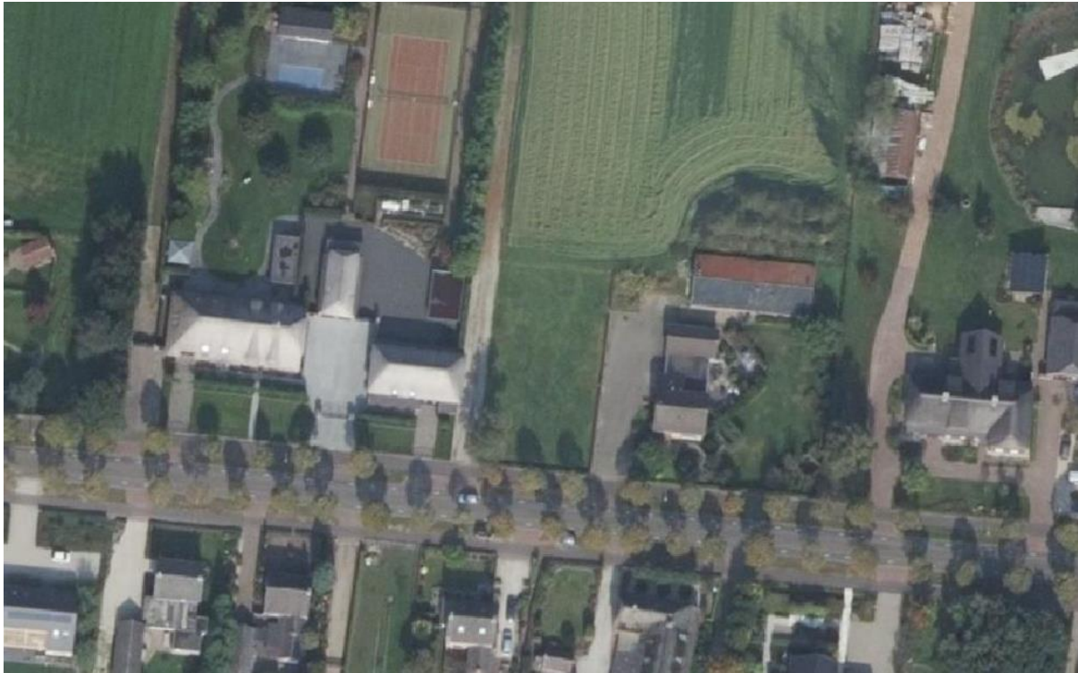
Figuur 4.2: Actuele luchtfoto