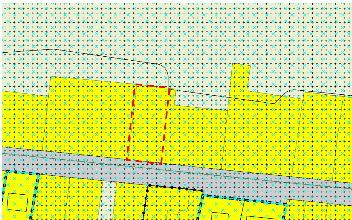
Figuur 1.2: Vigerend bestemmingsplan plangebied

Voor het plangebied zijn bestemmingsplan 'Buitengebied' (vastgesteld 12 november 2014) en 'Buitengebied, herziening 1' (vastgesteld 1 oktober 2015) van de gemeente Landerd de geldende bestemmingsplannen (zie figuur 1.2). Ter plaatse gelden de bestemming 'Wonen', de dubbelbestemmingen 'Waarde – Archeologie 2' en 'Waarde – Archeologie 4' en tot slot de gebiedsaanduiding 'reconstru-tiewetzone – verwevingsgebied'.