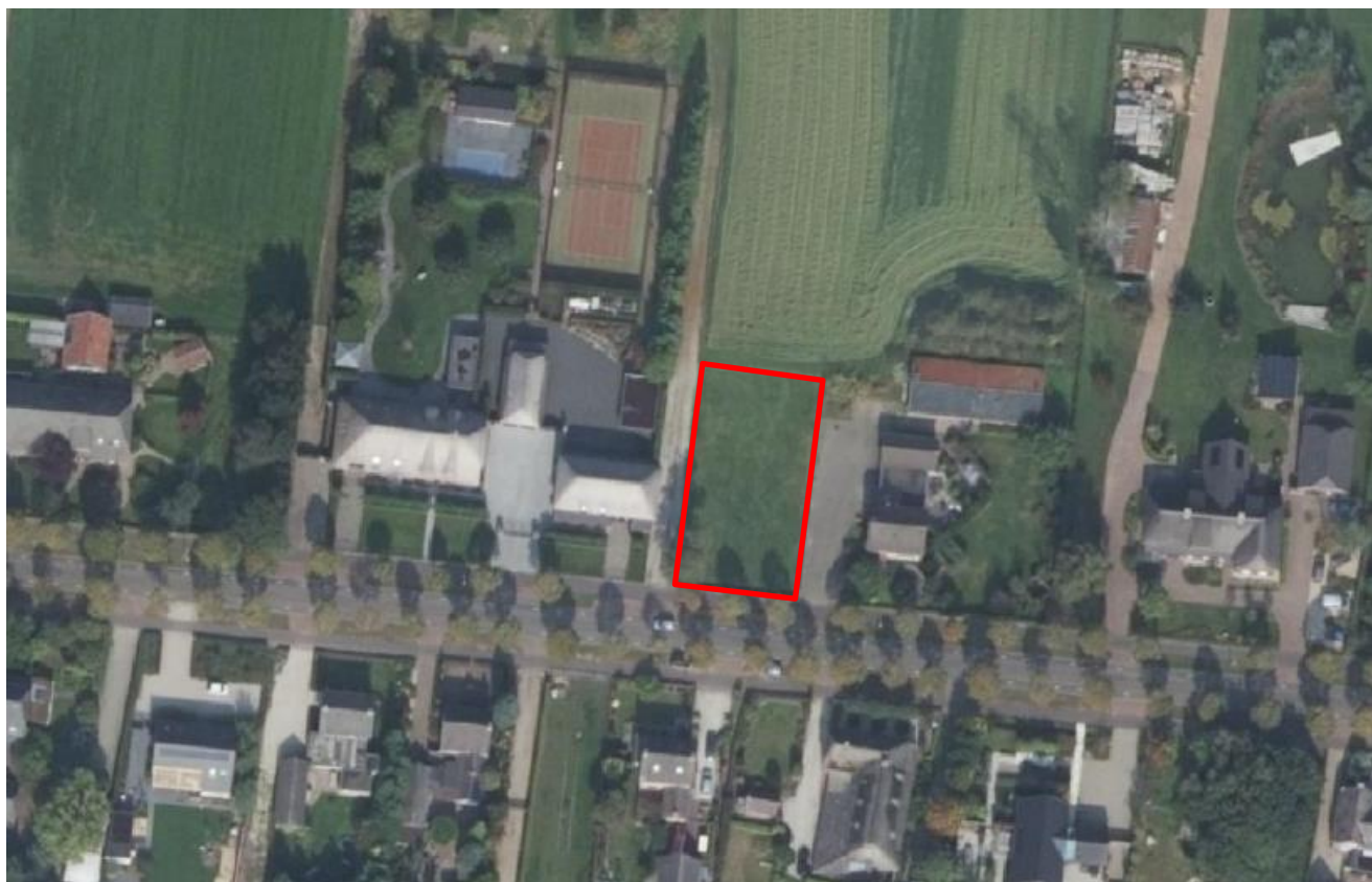
Figuur 1.1: (Globale) ligging plangebied