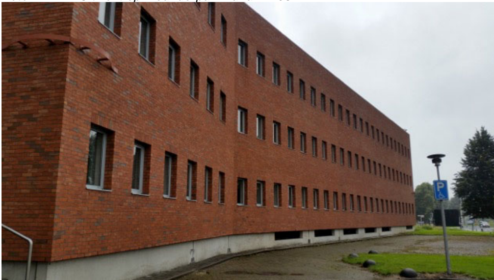
Foto 2 Buitenmuur Meanderpark waarin balkondeuren worden gesitueerd.