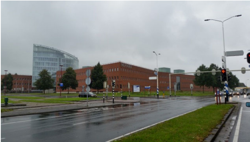
Foto 1 Uitzicht op Meanderpark vanaf N408.