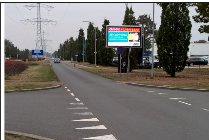
reclamezuil nieuwe situatie