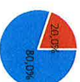
Bezoekers Nederland - buitenland

* Gemiddelde uit wielergerelateerde evenementen uit WESP studies.