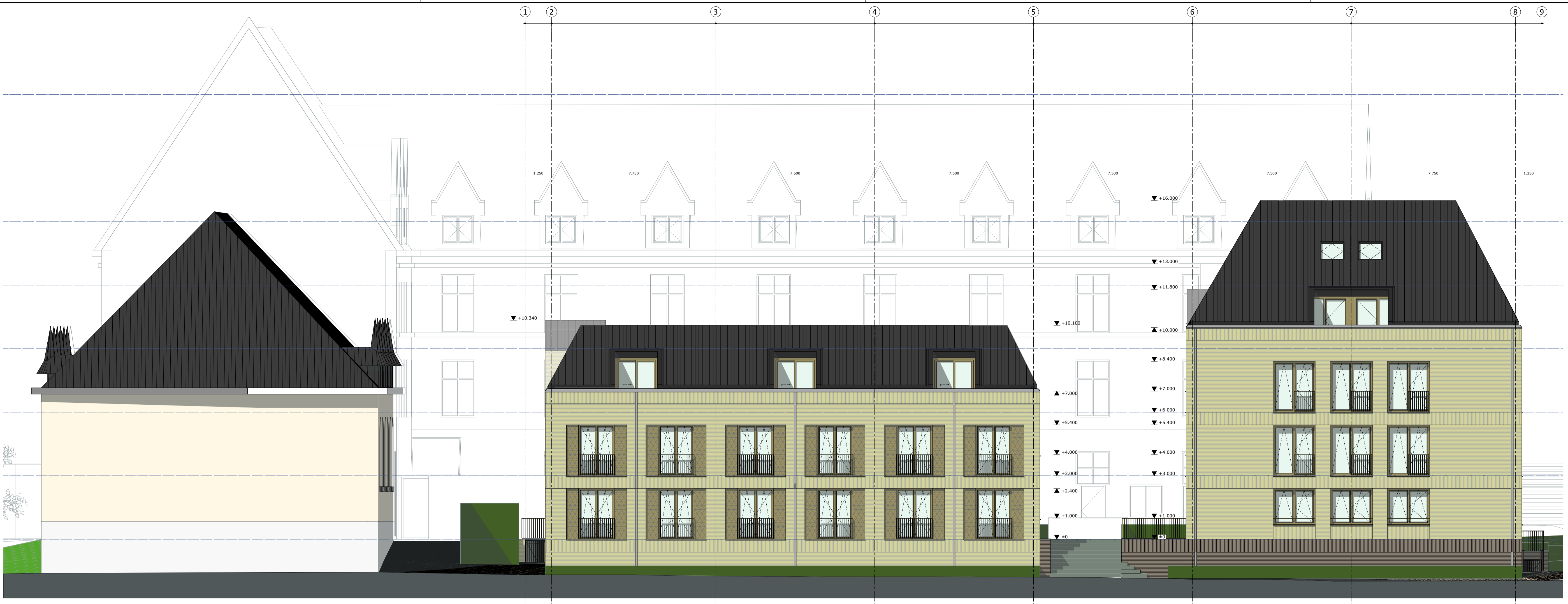
1:100 Voorgevel G01