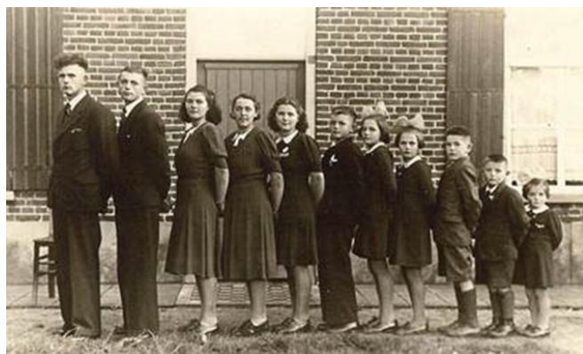
Een portret van een familie zoals er vele waren in die jaren

Al met al was het een zeer boeiend verhaal, waar René Bastiaanse het wel en het wee van die tijd op een bijzondere manier heeft belicht