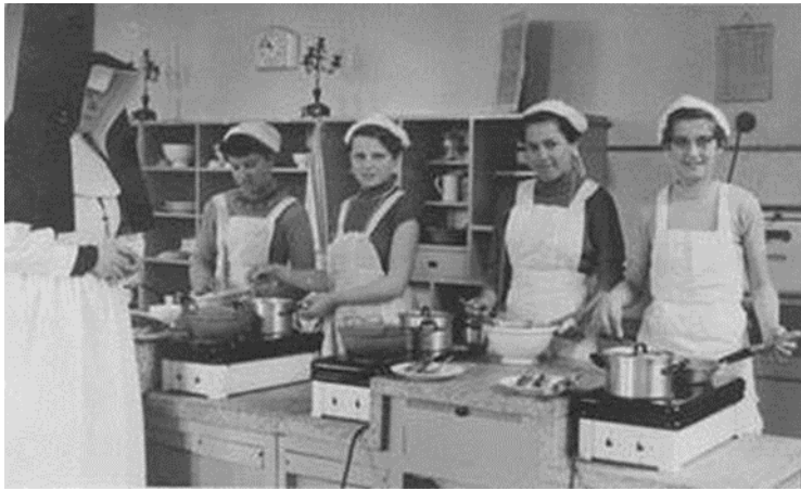
De huishoudschool was de enige school waar meisjes uit de lagere bevolkingsgroep heen werden gestuurd