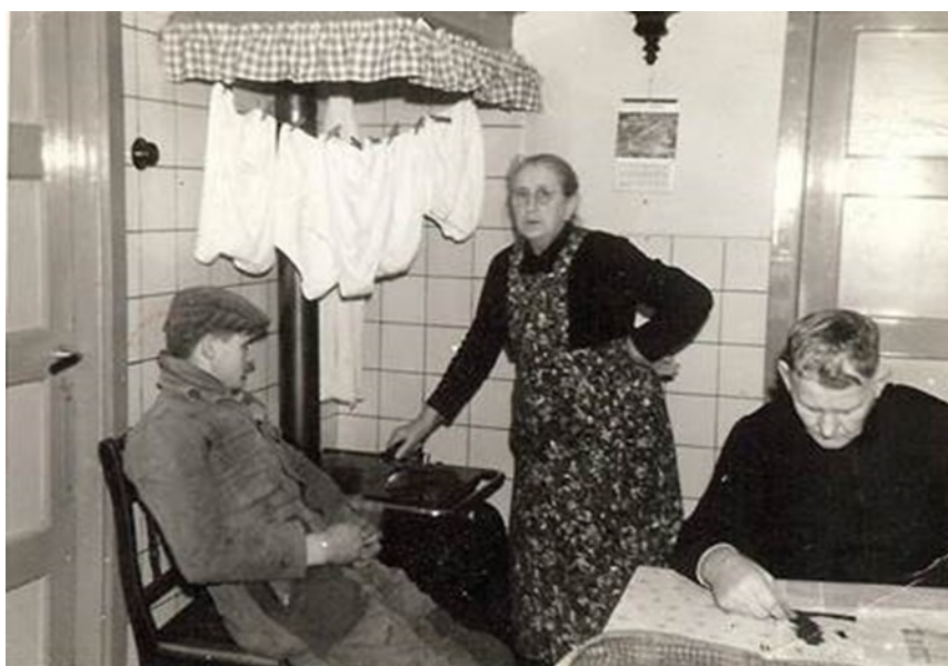
Zo zag het er op wasdag uit in de keuken, want de onderbroeken moesten gedroogd worden