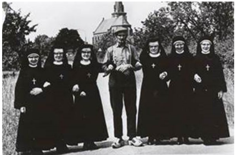
Hier een vader die maar liefst zes dochters in het klooster had !