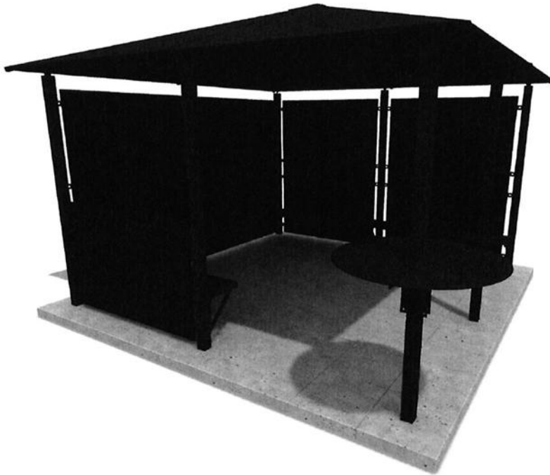
Figuur 1 Definitief ontwerp JOP Ercalaan

Voor de JOP in Aalst waren voldoende wensen en ideeën opgehaald waarmee twee ontwerpen zijn gemaakt voor de nieuwe JOP. Deze ontwerpen zijn schriftelijk voorgelegd aan de jongeren en de omwonenden. Men kon tot 1 juli 2019 hun voorkeur voor één van de ontwerpen kenbaar maken.