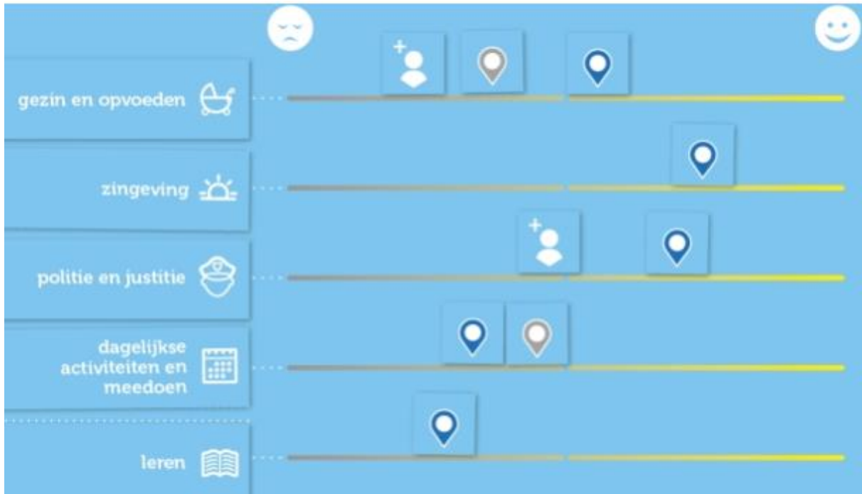
Voorbeeld van een magneetbord: "Wat telt"

Daarnaast is feedback van zowel de hulpvragers en hun (sociaal) netwerk erg belangrijk. In 2016 hebben we in mei een tevredenheidsonderzoek uitgevoerd onder alle burgers die op dat moment door ons ondersteund werden. Daarnaast hebben we in 2017 een start gemaakt met het versturen van een tevredenheidsformulier bij het afsluiten van het traject. Beide zijn helpend voor het verbeteren van onze werkwijzen.