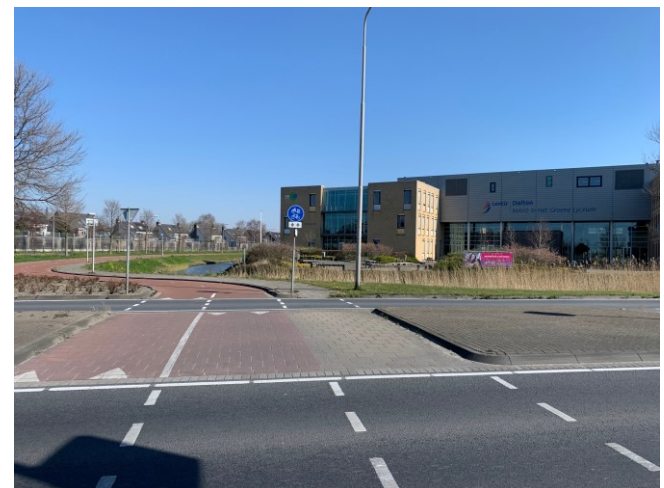
De Galgeweg met aansluiting op de Kruisbroekweg