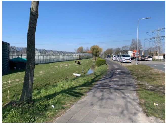
Het begin van de Galgeweg (zuidkant)