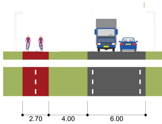
Profiel huidige situatie (Galgeweg richting Kruisbroekweg)