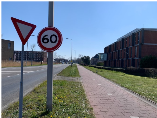
De Galgeweg aan de noordkant (t.h.v. de Kruisbroekweg)