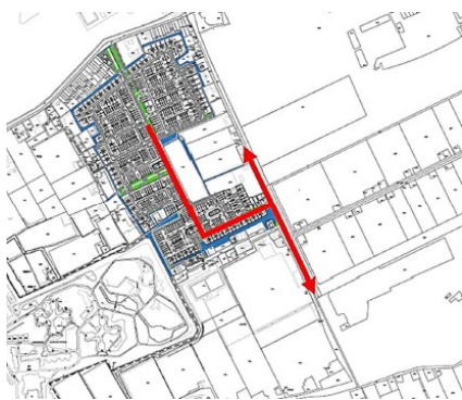
Situering aansluiting Westmade - Noord op Oorberlaan

De beoogde locatie van de aansluiting op de Oorberlaan is weergegeven in onderstaand figuur. Op basis van de geprognosticeerde verkeersaantallen zal geen probleem ontstaan met de verkeersafwikkeling van deze aansluiting.