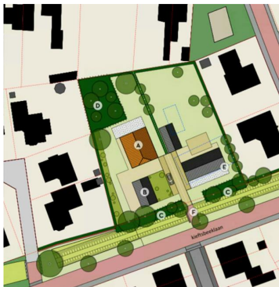
Figuur 2 Beoogde situatie

Het perceel heeft in het vigerende bestemmingsplan Kollenveld-Bornsestraat (2013) de bestemming 'Wonen' en is voorzien van één bouwvlak voor de bestaande woning (woonboerderij). Het ruimtelijke voornemen is dan ook in strijd met het bestemmingsplan. Hierom dient het bestemmingsplan te worden aangepast. Hiervoor is het ontwerpbestemmingsplan Kieftsbeeklaan 36-38 opgesteld.