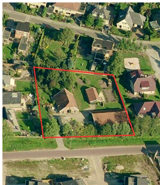
Figuur 1 Bestaande situatie

Het betreft een voormalig agrarisch erf dat in de afgelopen decennia is omringd door stadsuitbreidingen. Op het perceel staan een woonboerderij en een drietal (grote) bijgebouwen. De ontwikkeling voorziet in het opsplitsen van het voor de bebouwde kom van Almelo in verhouding grote woonperceel in twee woonpercelen. Op deze wijze ontstaan twee nog steeds relatief forse woonpercelen met vrijstaande woningen. Dit initiatief past goed in het bebouwingsbeeld ter plaatse, waar de percelen over het algemeen smaller en kleiner zijn. De behoudenswaardige woonboerderij gelegen op de linkerzijde van het perceel blijft staan en blijft net als in de huidige situatie fungeren als woning. De ontsluiting blijft net als in de huidige situatie plaatsvinden via één inrit. De bijgebouwen aan de rechterzijde van het perceel worden gesloopt ten behoeve van een nieuw bouwkevel met daarop een in het bebouwingsbeeld van de Kieftsbeeklaan, maar ook een bij de historie van de locatie passende woning met bijgebouw.