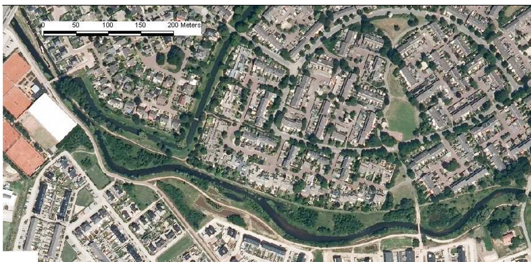
Figuur 5.1 Beekinrichting Barneveldsebeek ten noorden van De Burgt