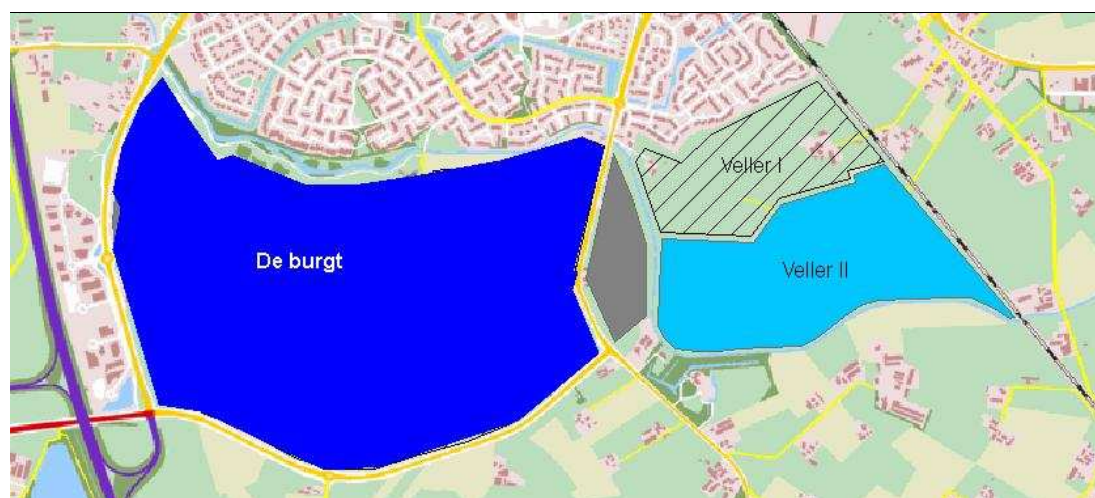
Figuur 2.1 Plangebieden De Burgt en Veller I en Veller II

Locaties waar de gemeente Barneveld voornemens is uit te breiden zijn onder meer Veller I en II en De Burgt. Deze locaties liggen aan de zuidzijde van Barneveld (zie bijlage 1). De Burgt wordt begrensd aan de zuidzijde door de Scherpenzeelseweg, in het westen door de Plantagelaan, het oosten door de Lunterseweg en aan de noordzijde door de Barneveldse beek. Deze begrenst het gebied van de Lunterseweg tot aan de Plantagelaan. De beek begrenst aan de west- en zuidzijde de plangebieden van Veller I en II (vanaf de spoorlijn Lunteren - Barneveld tot aan de Lunterseweg). De oost- en noordzijde van de plangebieden worden respectievelijk begrensd door het spoor en de zuidzijde van de huidige bebouwde kom van Barneveld.