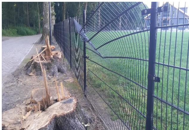
vandaag 22-08-2022