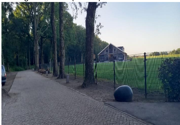
vandaag 22-08-2022