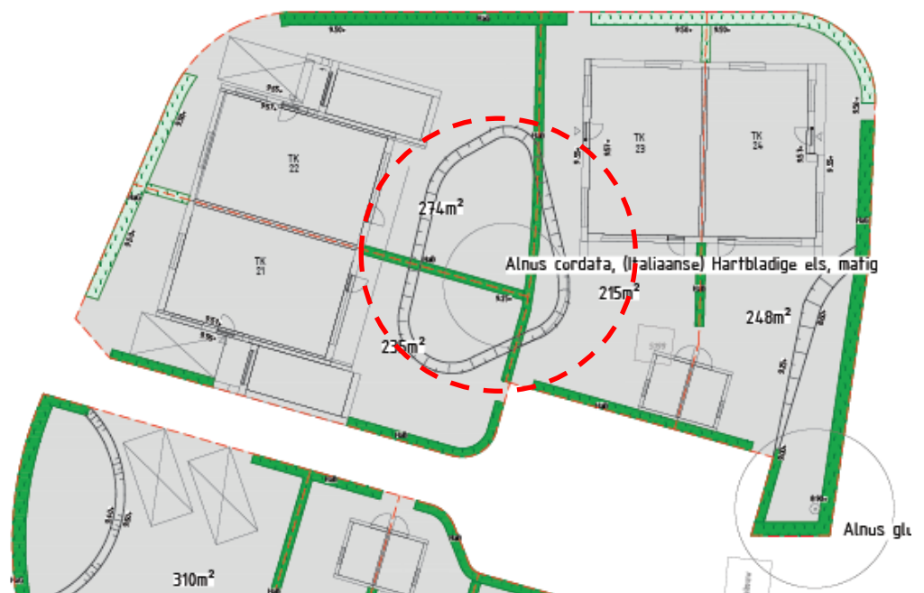
Figuur 1: situatie beplantingsplan, bijlage bij ontwerpbestemmingsplan. In rood omcirkeld de boom incl. de verlaging in het maaiveld die niet duurzaam kan worden gehandhaafd.