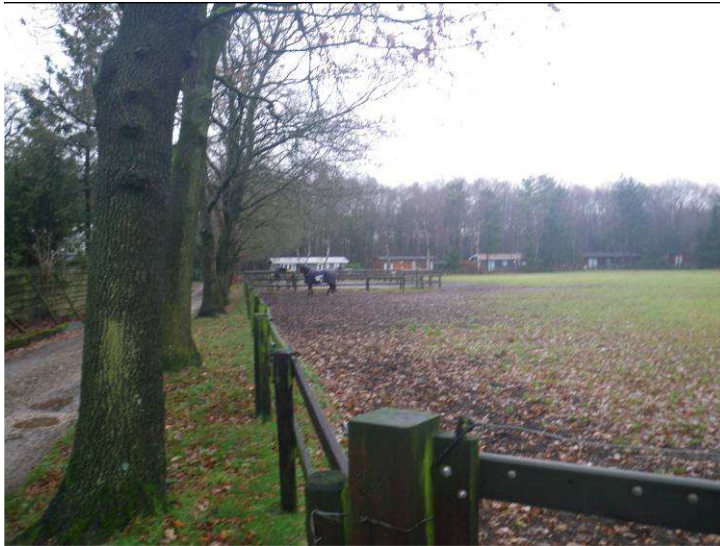
Figuur B1.1 Herontwikkelingslocatie noordelijk terreindeel