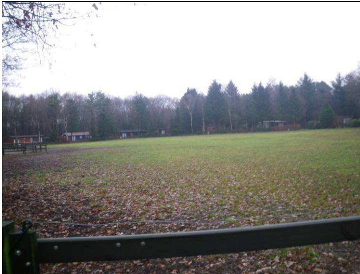
Figuur B1.2 Herontwikkelingslocatie noordelijk terreindeel