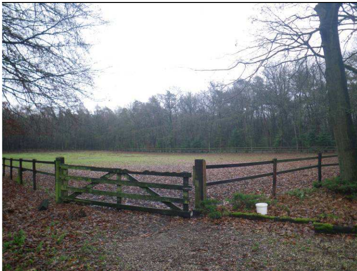
Figuur B1.4 Herontwikkelingslocatie zuidelijk terreindeel