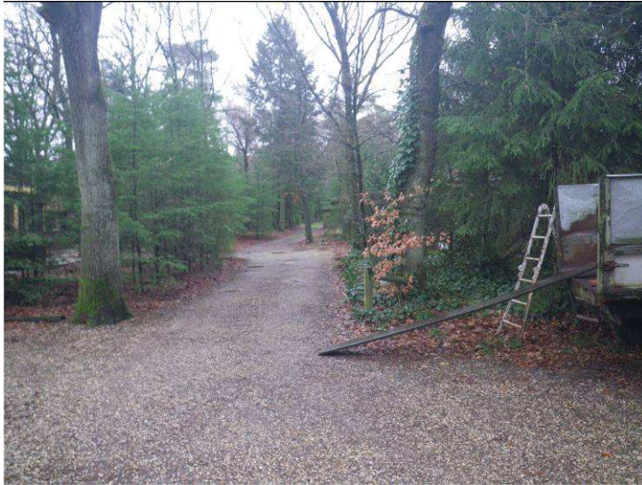
Figuur B1.3 Herontwikkelingslocatie zuidelijk terreindeel