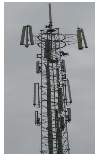
Het "digitale" asbest van Nu

Geachte leden van College en Gemeenteraad,