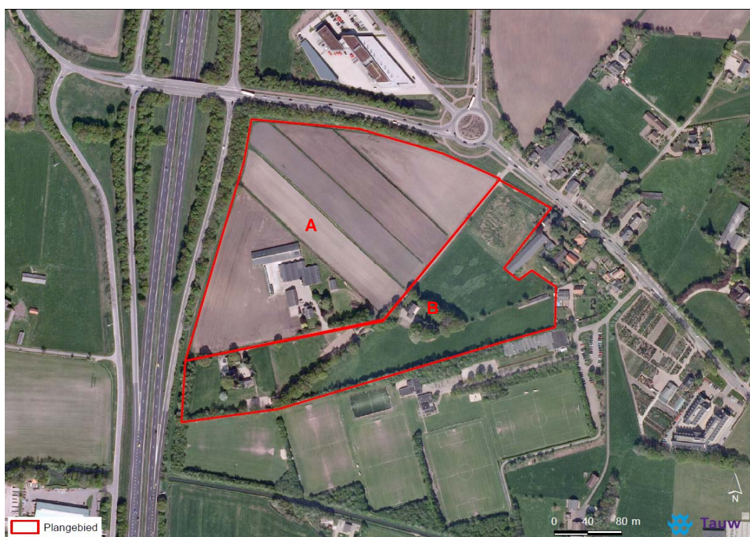
Figuur 2.1 Ligging plangebied (globaal begrensd). Het betreft het plangebied aangeduid met een B.

Om (globale) locaties aan te duiden wordt in de ecologie veel gebruik gemaakt van een raster van kilometerhokken, zogenaamde RD-coördinaten. Verspreidingsgegevens van dier- en plantensoorten worden veelal per kilometerhok gedocumenteerd. Het plangebied ligt in kilometerhok 167-462. De onderstaande figuur geeft de ligging van het plangebied (aangeduid met een B) globaal weer.