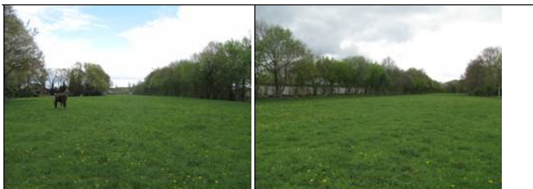
Figuur 2.2 Impressie van het plangebied.

Het plangebied ligt in een hoek tegen de snelweg A30 en de Thorbeckelaan aan. Het gebied bestaat op dit moment uit (agrarische) bebouwing en bijbehorende gronden. Aan de west- en noordzijde van het gebied bevindt zich een bomenrij met ondermeer Zomereik, Es, Meidoorn en Els, met onderlangs een kleine sloot. Aan de zuidzijde bevindt zich kleinschaliger agrarisch gebied. Enkele bomenrijen en kleinschalige paardenweiden typeren de zuidzijde van het plangebied.