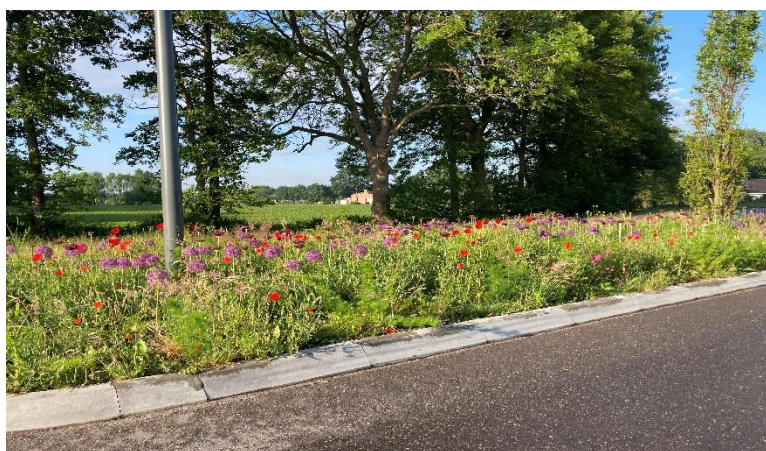
Einde Holzenboschlaan Voorthuizen vanochtend