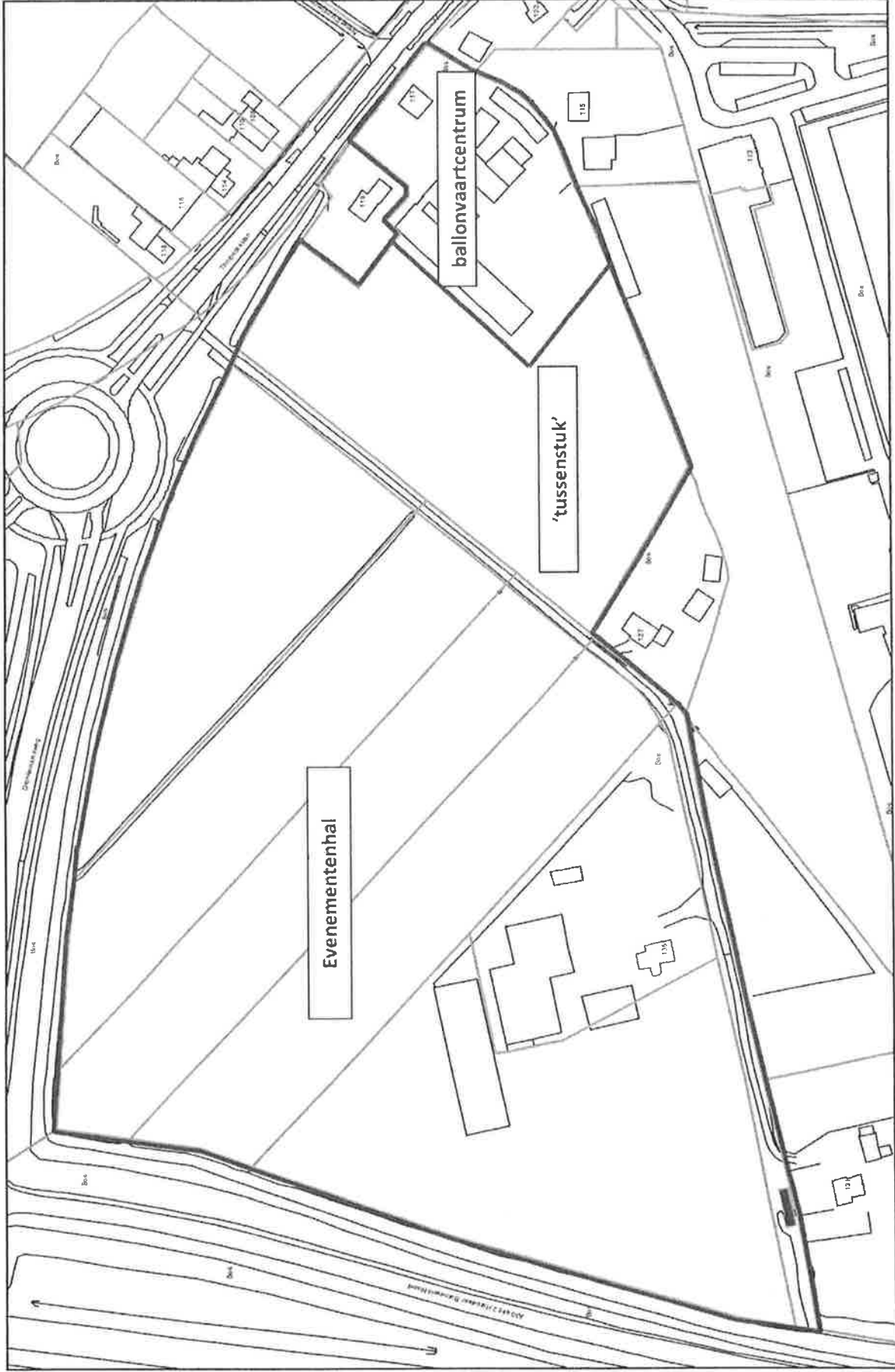
Situatietekening Thorbeckelaan Zuid