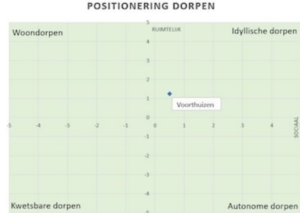
Figuur 1: Vitaliteitsmodel dorpen

Een brandingsstrategie moet de unieke kwaliteiten van Voorthuizen beter voor het voetlicht brengen.