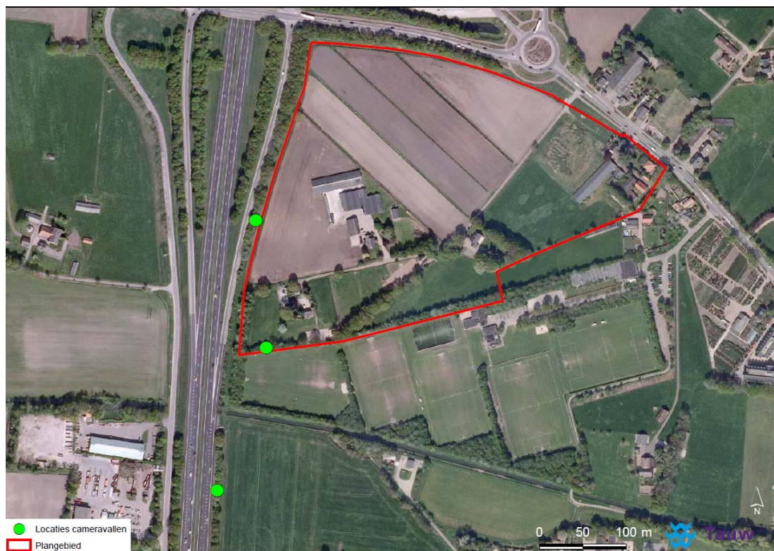
Figuur 2.1 Locaties cameravallen