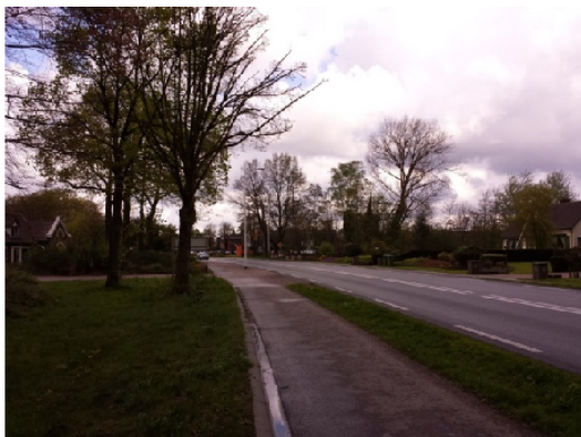
Foto 3 Stationsweg