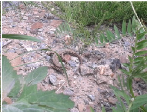
Foto 8 Levendbarende hagedis in de spoorberm