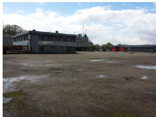
Foto 6 Bedrijventerrein de Harselaar