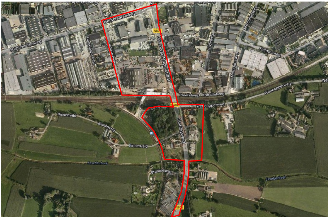
Figuur 1 Ligging en begrenzing plangebied