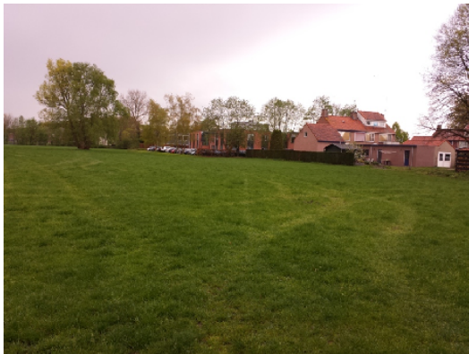
Foto 1 Toekomstige terrein bijpass