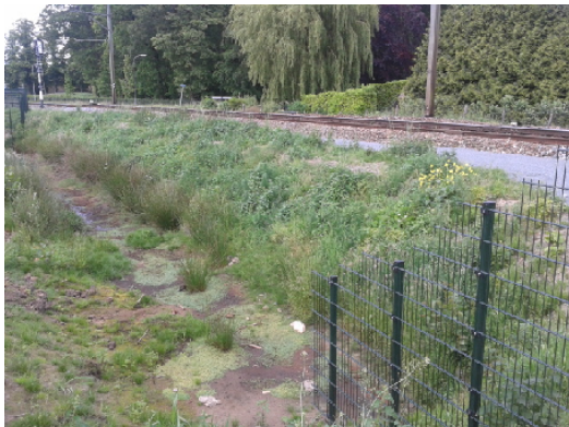
Foto 7 habitat levendbarende hagedis

Deze (of een andere goedgekeurde) gedragscode is niet rechtstreeks bruikbaar. Om te werken conform de gedragscode is het nodig om een op maat gemaakt ecologisch werkprotocol op te stellen en te gebruiken bij de uitvoering. In dit werkprotocol worden mitigerende maatregelen uitgewerkt.