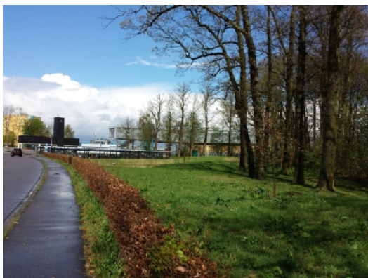
Foto 5 Station Barneveld Noord