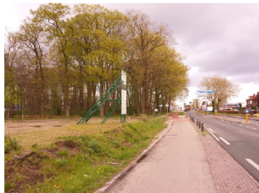
Foto 4 Roekenbos