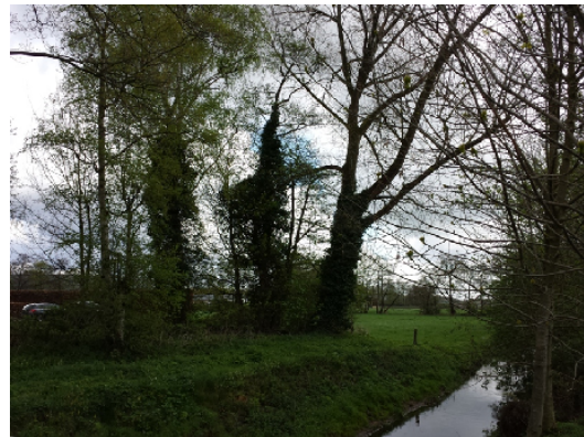
Foto 2 Oever langs de Esvelderbeek