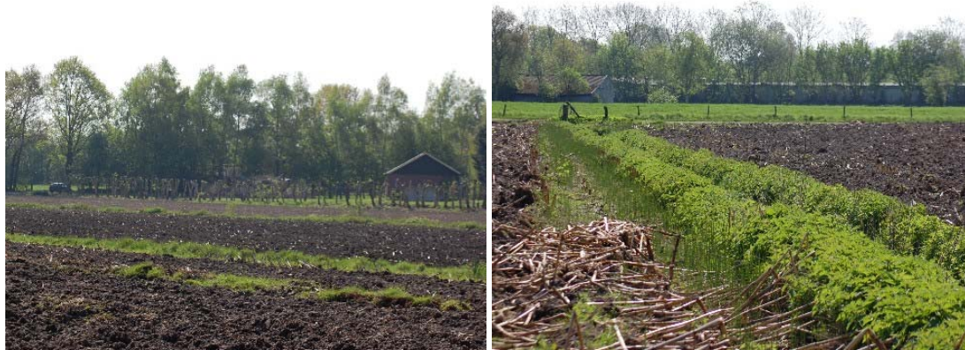
Figuur 2.2 Impressie van de situatie in het plangebied. Foto's genomen in 2009.