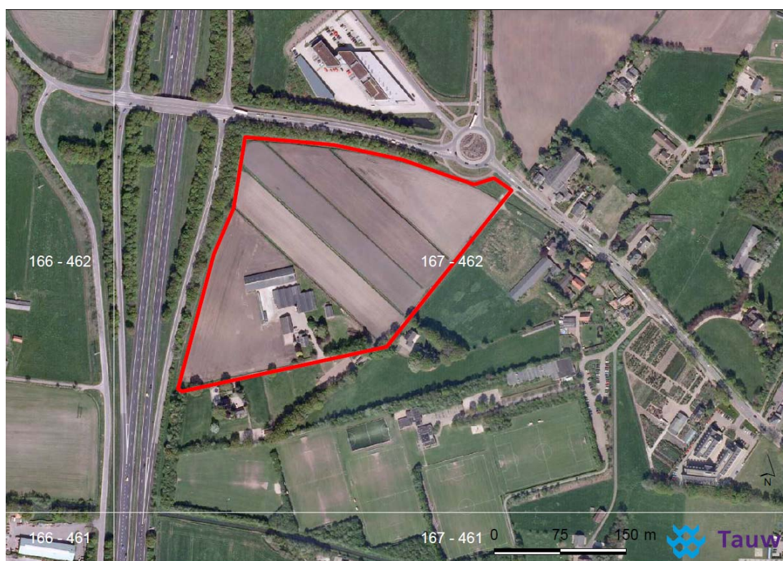
Figuur 2.1 Globale ligging van het plangebied (rode contour) in Barneveld.

Het plangebied is gelegen in kilometerhok 167 - 462. Onderstaande figuur 2.1 geeft de ligging van het plangebied en kilometerhokken weer.