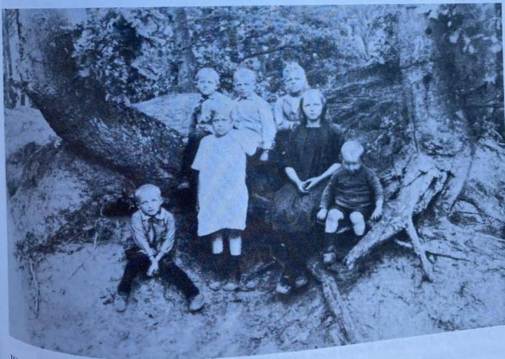
Kinderen op de Heuveltjes, tegenover de Viskom.