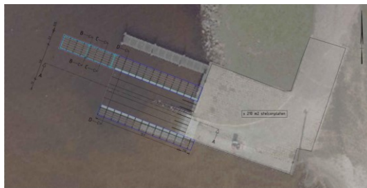
Bestaande vs Nieuwe situatie