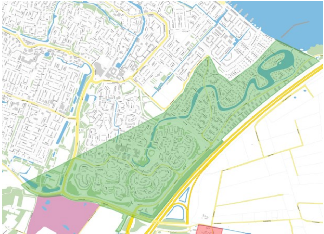
Afbeelding 3: Komgrens Wet Natuurbescherming Blaricum Bijvanck en Blaricummermeent (groen gearceerd)

Door het vaststellen van de komgrens Wet natuurbescherming wordt bepaald wie bevoegd gezag is voor het beoordelen van een Omgevingsvergunning voor het vellen van houtopstanden (kapvergunning). In het algemeen is de provincie bevoegd gezag buiten de komgrens en de gemeente binnen de komgrens. Via de APV kan daar een uitzondering op worden gemaakt, bijvoorbeeld voor bomen in een tuin bij een boerderij.