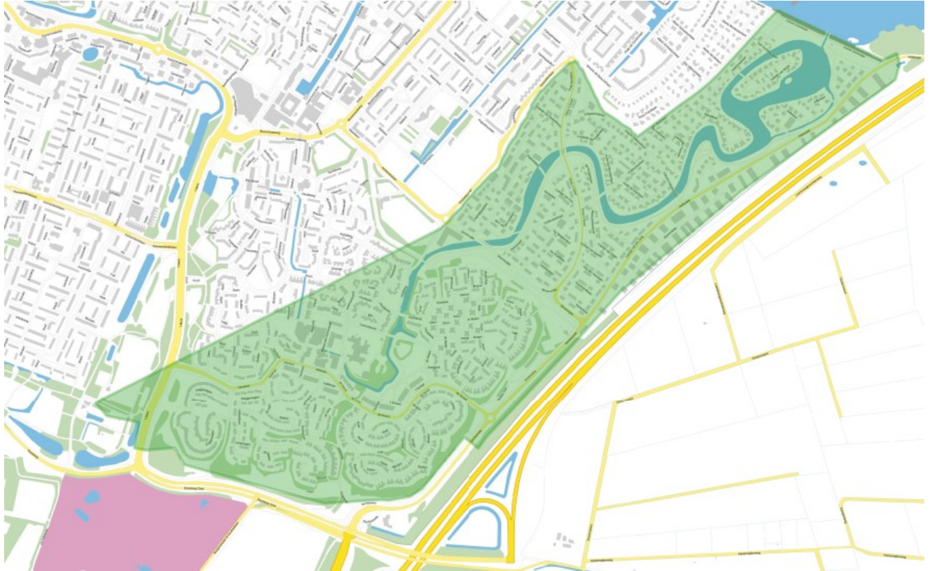
Afbeelding 1: Komgrens Wegenverkeerswet Blaricum Bijvanck en Blaricummermeent (groen gearceerd)

Door het vaststellen van de komgrens Wegenverkeerswet kan de gemeente bepalen welke snelheid van toepassing is binnen de gemeente en handhaven op basis van de APV. De voorgestelde komgrens Wegenverkeerswet sluit aan bij de huidige situatie (bebouwde kom borden) en houdt rekening met geplande gebiedsontwikkelingen.