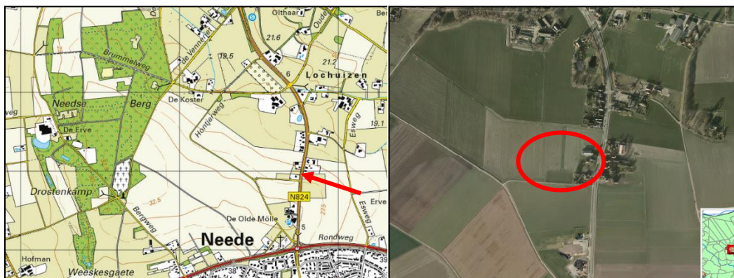
Ligging plangebied (niet op schaal)

Het perceel Diepenheimseweg 29 ligt ongeveer 500 meter ten noorden van de kern Neede langs de provinciale weg Neede-Diepenheim (N824). Het bevindt zich aan de flank van de Needse Berg op korte afstand van burgerwoningen en op circa 300 meter afstand van de monumentale Hollandsche Molen.