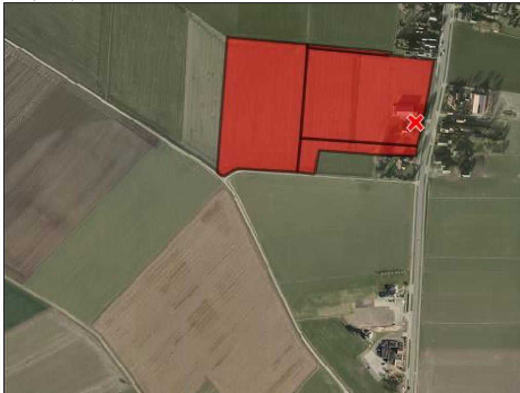
Luchtfoto met globale begrenzing plangebied (voorjaar 2018)

Het plangebied van dit bestemmingsplan omvat het adres Diepenheimseweg 29 in Neede en beslaat de percelen kadastraal bekend gemeente Neede, sectie G nummers 1081, 2725, 2726 en 3787.