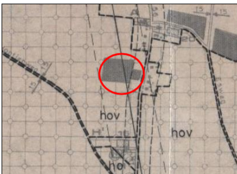
Fragment plankaart bp “Buitengebied, herziening 1987” (niet op schaal)

Volgens de bouwvoorschriften van het geldende bestemmingsplan mag het bouwvlak worden bebouwd door bedrijfsbebouwing met een goothoogte van 6,5 meter en een bouwhoogte van 10 meter. Daarbij kennen deze voorschriften ook vrijstellingsmogelijkheden voor onder meer het bouwen tot op de zijdelingse perceelsgrens en het aan één zijde overschrijden van de grenzen van het bouwvlak tot maximaal 15 meter.