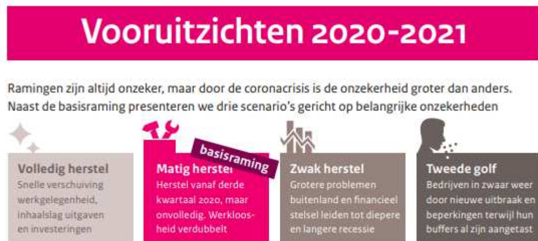
Figuur 1: CPB, juniraming 2020

Door de wereldwijde corona-uitbraak is de onzekerheid over de economische ontwikkeling zeer groot. Onzeker is hoe sterk de economische activiteiten in het eerste halfjaar zijn afgenomen en hoe snel de economie daarna gaat herstellen. Verder is ook het verloop van de pandemie - en in het kielzog daarvan de versoepeling of aanscherping van maatregelen - onzeker. Het Centraal Planbureau heeft in de juniraming ruim aandacht besteed aan de huidige economische situatie en heeft naast de basisraming drie scenario's uitgewerkt die de onzekerheid ten aanzien van zowel het economisch herstel als de ontwikkeling van de pandemie verkennen. Aan de economische kant wordt een scenario geschetst waarin de diepte van de recessie meevalt en het herstel krachtig is en een scenario met een diepe val en een zwak herstel. De basisraming met een matig herstel ligt daar tussenin. In het epidemische scenario wordt de economie zwaar getroffen als een tweede golf van besmettingen uitbreekt.