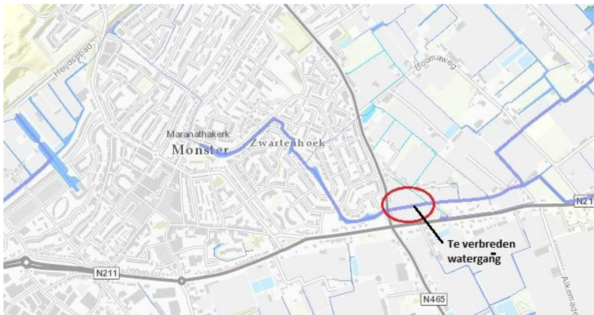
Figuur 1: ligging Boomawatering bij Monster

De Boomawatering start bij het dorp Monster in het Westland en eindigt bij de Uithof op de grens met de gemeente Den Haag. Het is een oude waterloop die een groot deel van de waterafvoer in het noordwestelijk deel van de gemeente Westland verzorgt.