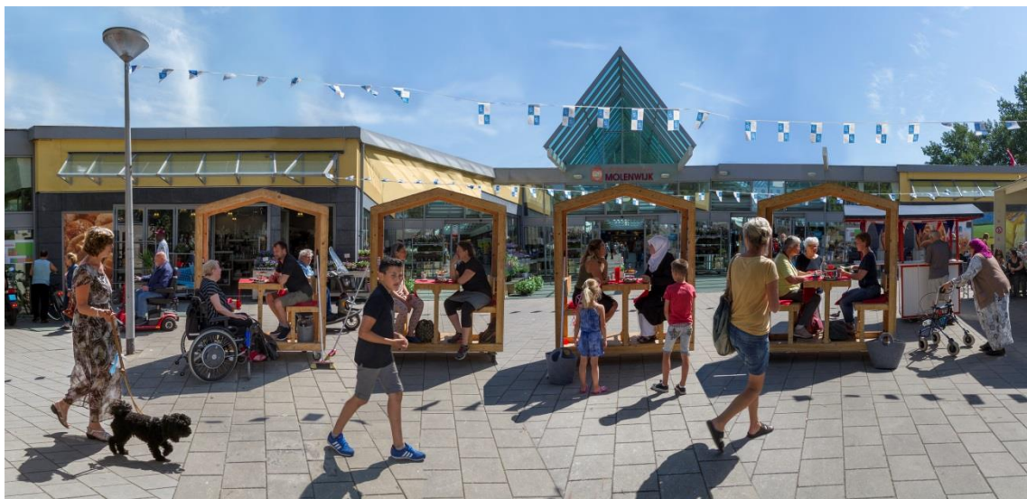
Praethuisjes project in het kader van de week tegen geweld .

aanvullend nodig is aan deskundigheidsbevordering en hoe dit efficiënt bereikt kan worden. Veilig Thuis heeft een belangrijke rol in het geven van voorlichtingen. Voor 2018 zijn ongeveer 200 bijeenkomsten gepland. Deze zullen vanwege toenemende vraag vanuit het veld nog meer dan voorheen vraaggericht worden ingezet. Ook verzorgt Veilig Thuis algemene preventie-activiteiten voor de hele regio. Daarnaast zijn er bijeenkomsten op de terreinen partnergeweld, kindermishandeling, eerge relateerd geweld, ouderenmishandeling, meisjesbesnijdenis en complexe scheidingen .