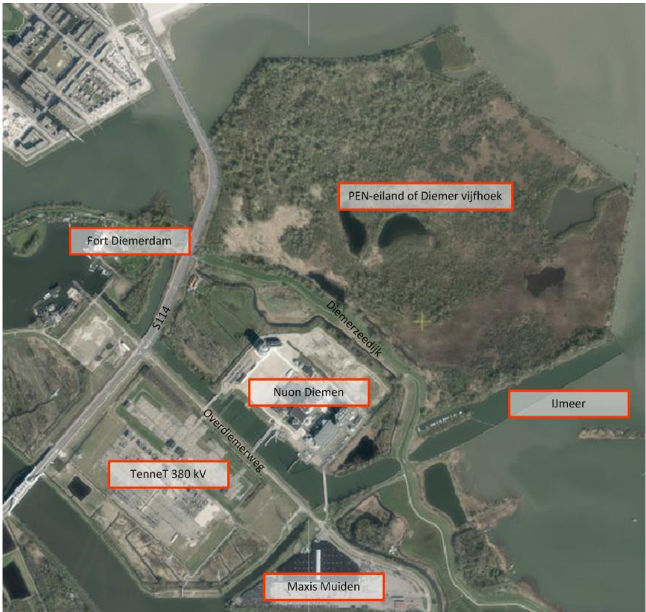
Figuur 2.4: Nuon-locatie en omgeving

In figuur 2.4 is een overzicht van de locatie en de omgeving te zien.