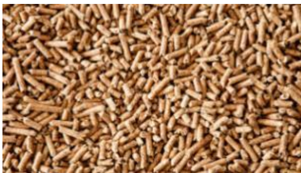
Figuur 2.1: Illustratie van verschijningsvorm van houtpellets

Houtpellets zijn afkomstig van de bosbouw. Bepaalde bosresiduen worden eerst extern grof vermalen, gedroogd, verkleind, geperst (gepelletiseerd) en gekoeld. Hierdoor kennen ze een laag vochtgehalte en een hoge energiedichtheid. In figuur 2.1 is ter illustratie de verschijningsvorm van pellets weergegeven en in tabel 2.1 enkele specificaties.