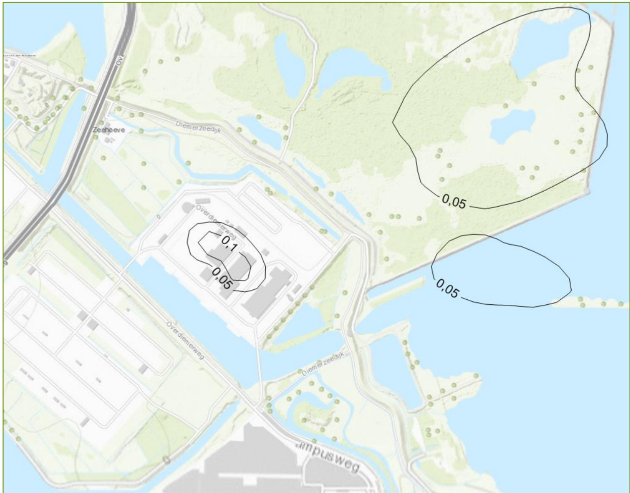
Figuur 5.1 Geurcontouren ten gevolge van de activiteiten Nuon (in ou_E/m^3 als 98-percentiel)

In de figuren 5.1 en 5.2 worden de berekende geurcontouren voor het verbranden van houtpellets als respectievelijk 98-percentiel en 99,9-percentiel weergegeven. Opgemerkt wordt dat de contouren de hoogste berekende waarden laten zien omdat de voor toetsing relevante waarden nergens worden berekend.