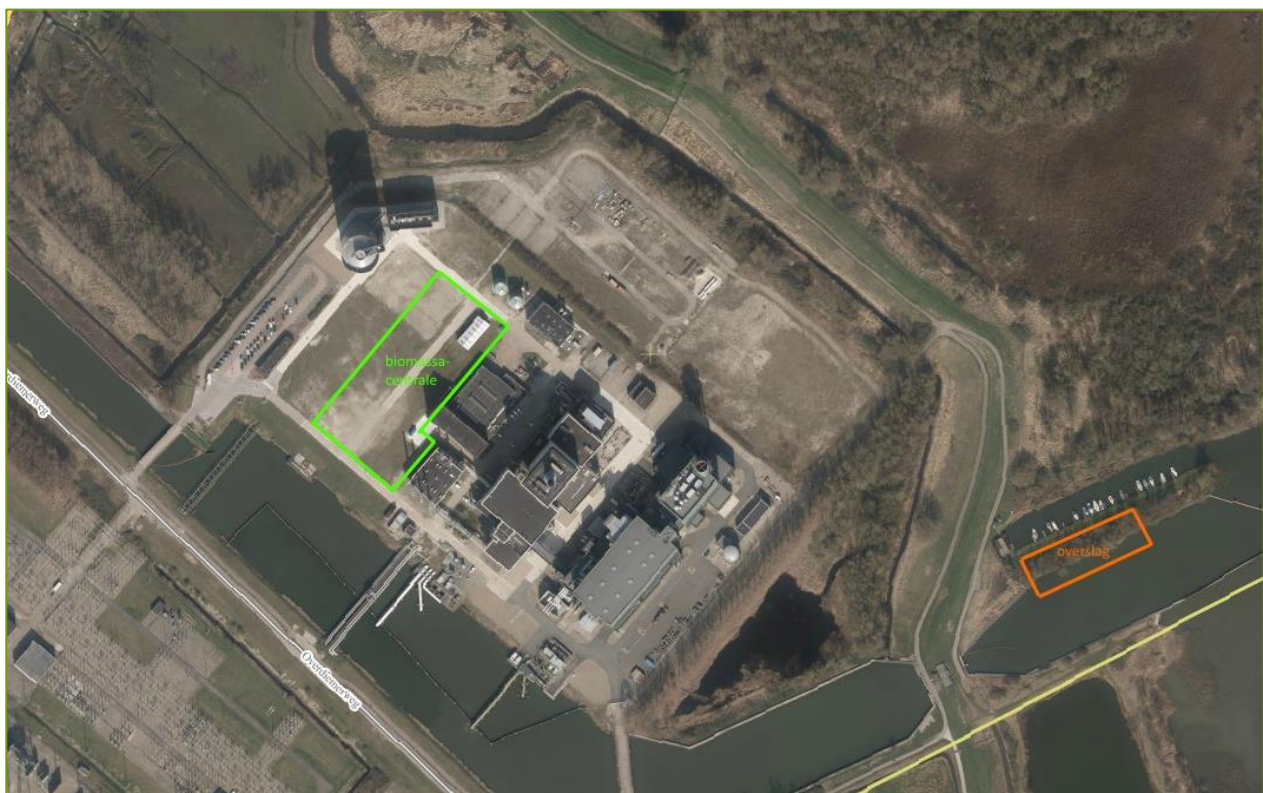
Figuur 3.1 Locatie en omgeving beoogde biomassacentrale

In figuur 3.1 is de locatie van het beoogde terrein voor de biomassacentrale aangegeven. De centrale wordt gerealiseerd naast de Diemen 33 en 34 centrales (DM33 en DM34) op het terrein van Nuon. Voor aanvoer van de houtpellets zijn twee scenario's beschouwd: 100% vrachtwagens en 100% binnenvaartschepen. Overslag vanuit schepen van de in te zetten houtpellets wordt beoogd ter hoogte van de jachthaven aan de Diemerzeedijk, gelegen ten oosten van de inrichting. Door middel van een gesloten transportband (tube conveyor) worden de houtpellets vervolgens naar de inrichting getransporteerd. Overslag van vrachtwagens vindt op het terrein zelf plaats.