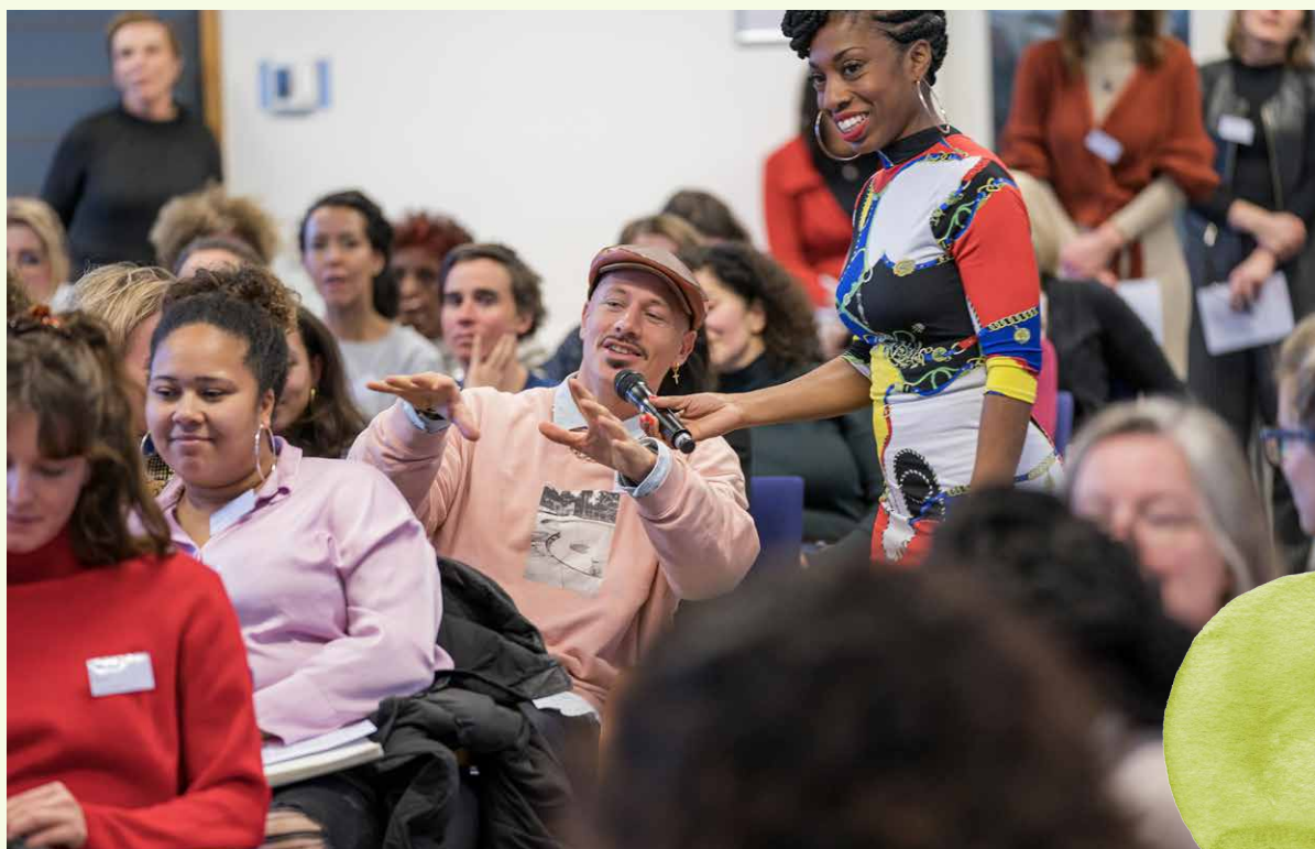
Informele en formele partners kwamen bijeen tijdens 'Heel Amsterdam Samen Sterker' op 8 december 2022.