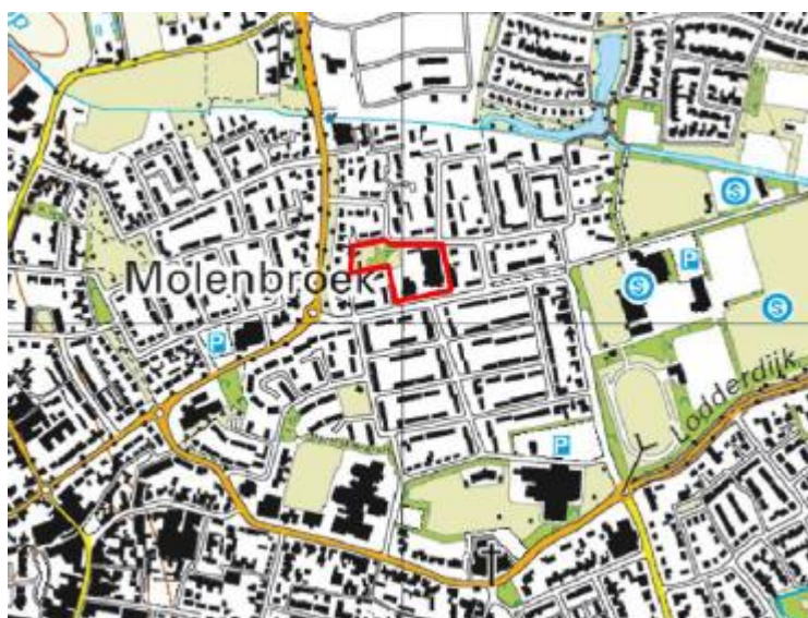
Afb. 1. Topografische ligging van het plangebied (rood omlijnd).

In een plangebied, gelegen aan de Pastoor Attendorenstraat te Gemert, wordt een herontwikkeling voorzien. De voormalige bebouwing (basisschool, kleuterschool en een kinderverblijf) zijn reeds gesloopt. De herontwikkeling zal bestaan uit het bouwen van een aantal woonhuizen met voorzieningen. De plannen zijn nu nog niet beschikbaar.