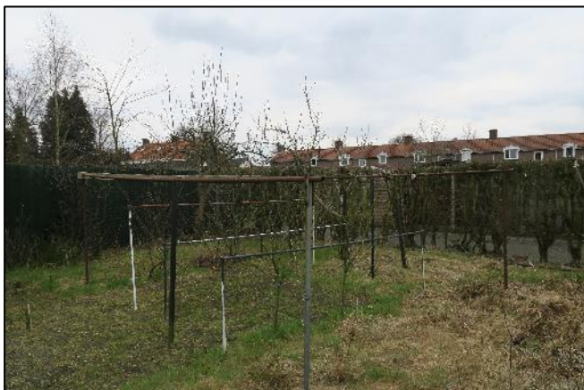
Foto 7. Deel van de tuin achter de woning aan Sint-Annastraat 47