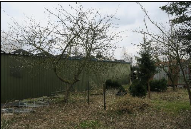
Foto 5. Deel van de tuin achter de woning aan Sint-Annastraat 47