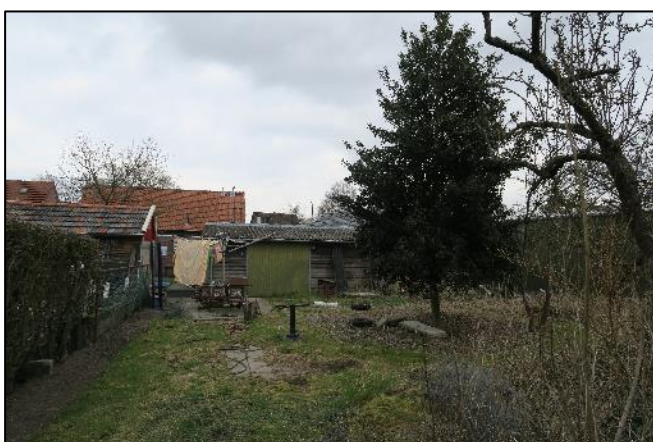
Foto 9. Deel van de tuin achter de woning aan Sint-Annastraat 47