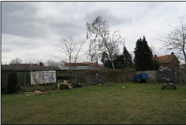
Foto 3. Deel van de tuin achter de woning aan Sint-Annastraat 49