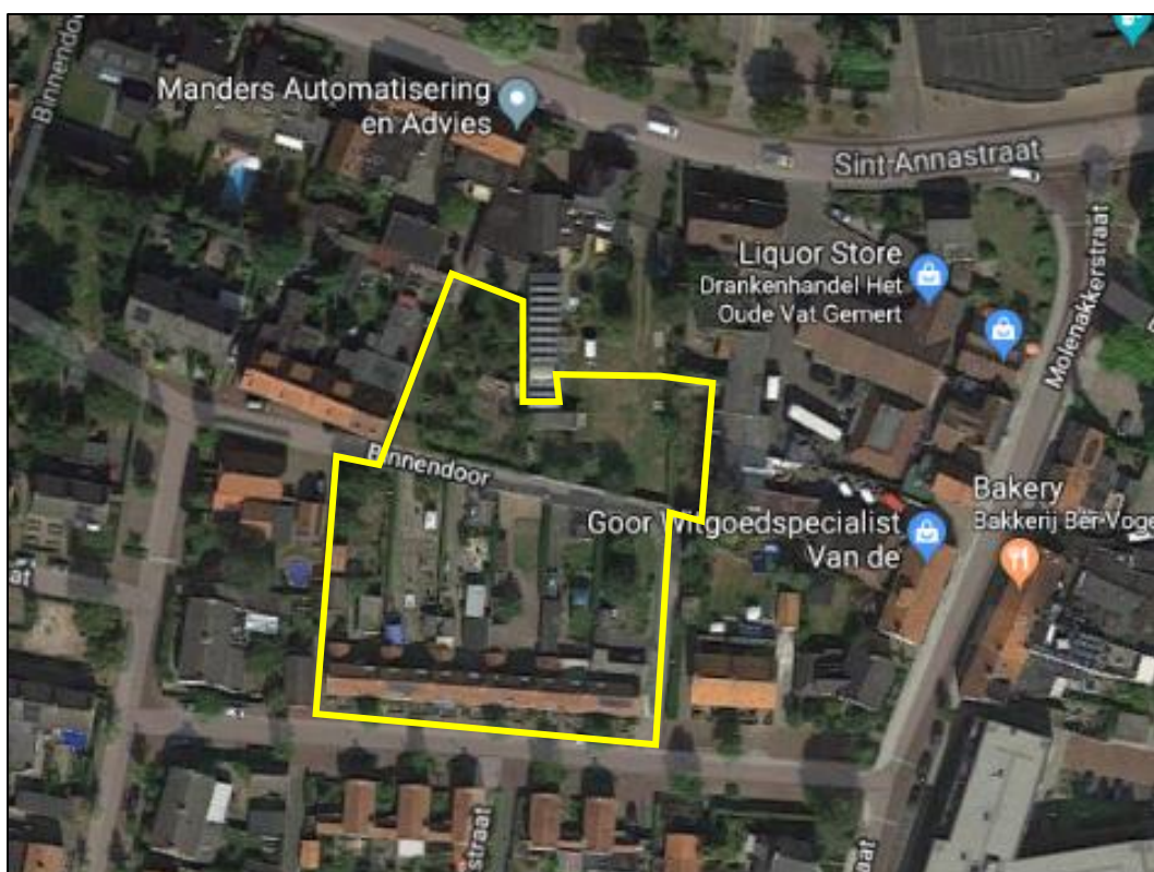
Figuur 2. Globale begrenzing van het plangebied (gele lijn)