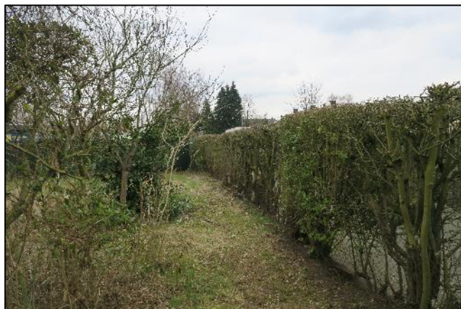
Foto 8. Deel van de tuin achter de woning aan Sint-Annastraat 47