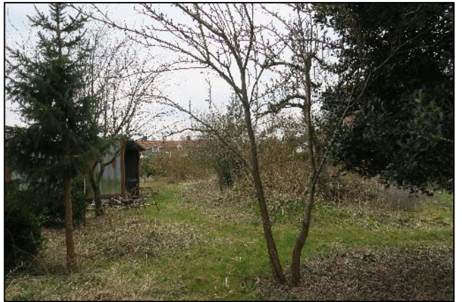
Foto 6. Deel van de tuin achter de woning aan Sint-Annastraat 47