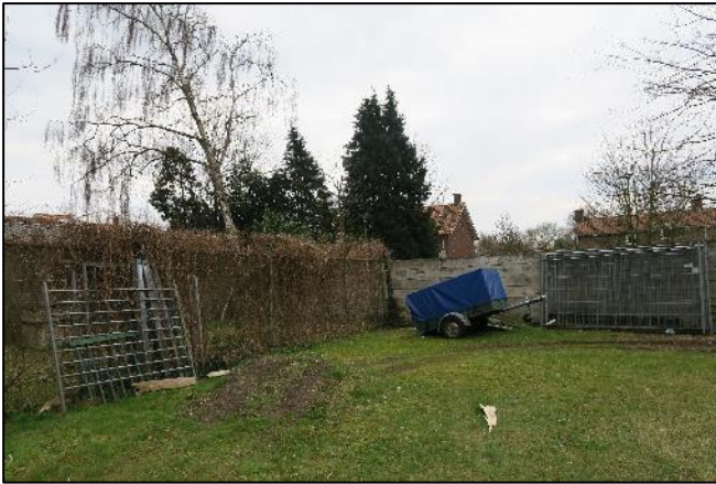
Foto 1. Deel van de tuin achter de woning aan Sint-Annastraat 49