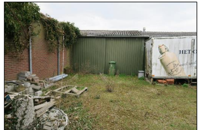
Foto 4. Deel van de tuin achter de woning aan Sint-Annastraat 49