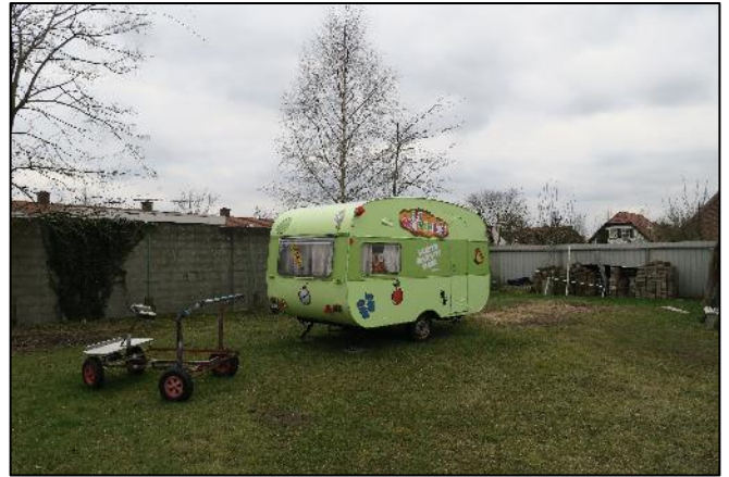
Foto 2. Deel van de tuin achter de woning aan Sint-Annastraat 49