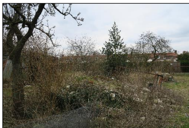
Foto 10. Deel van de tuin achter de woning aan Sint-Annastraat 47