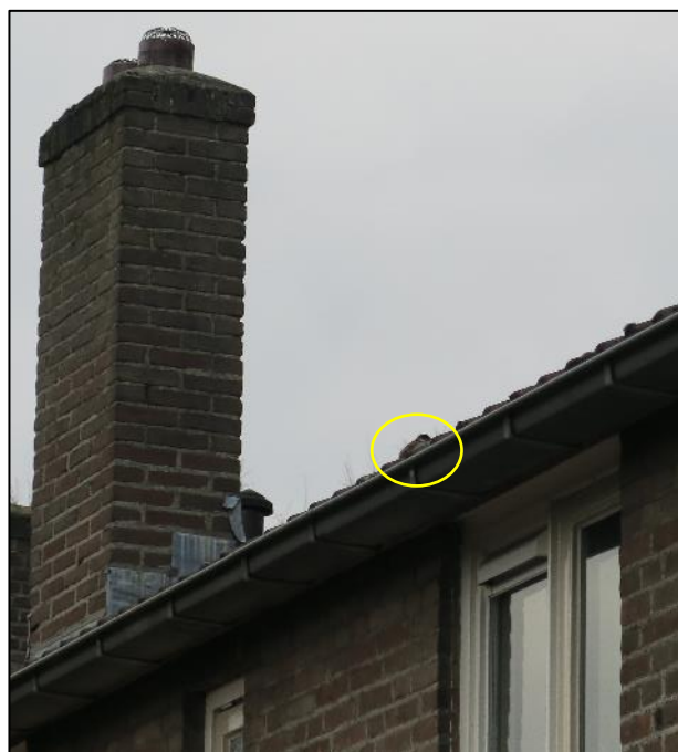
Foto 5. Achterzijde Nieuwe uitleg 32 met huismus bij de dakrand (gele cirkel).