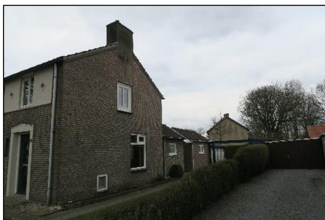
Foto 3. Oostgevel Nieuwe uitleg 26