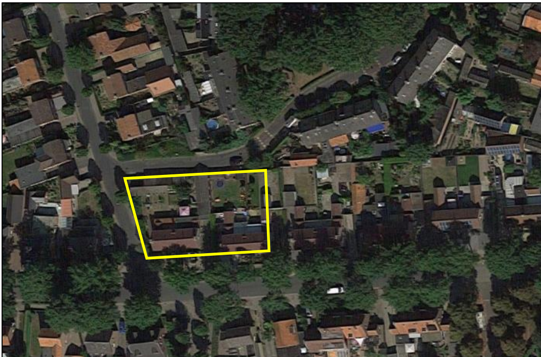
Figuur 2. Globale begrenzing van het plangebied (gele lijn)