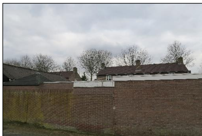
Foto 4. Achterzijde woningen Nieuwe uitleg vanaf De Bremmen