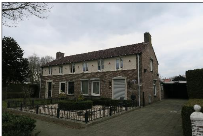
Foto 1. Woningen aan de Nieuwe Uitleg