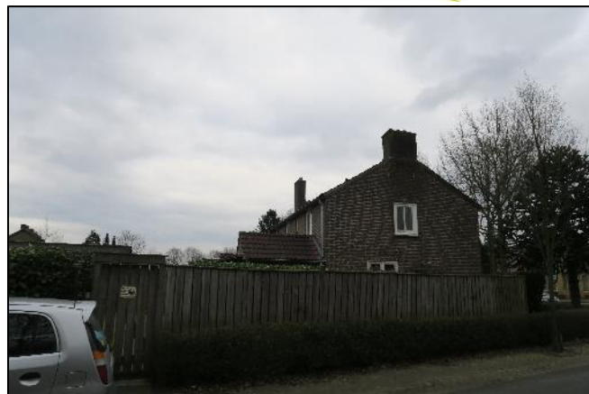
Foto 2. Westgevel Nieuwe uitleg 32