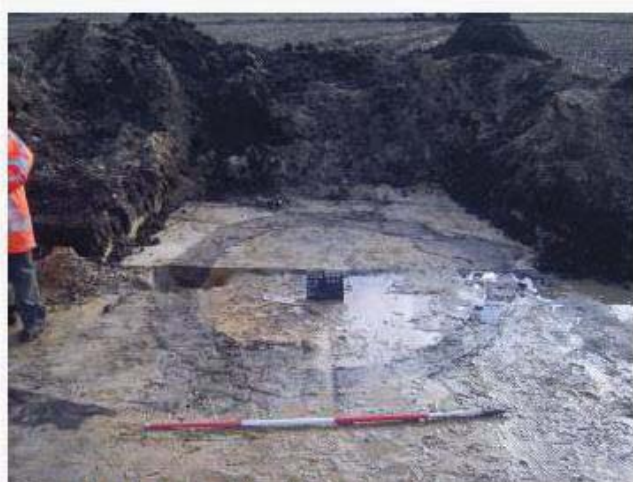
Foto mitrailleursnest in vlak te Gemert.