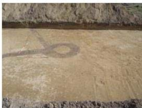
Foto mitrailleursnest in het vlak te Wehl.