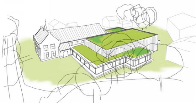
Parochiehuis variant 1 - scenario 2