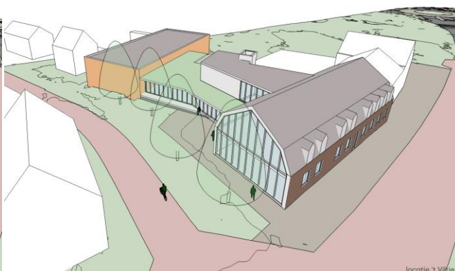
Locatie 't Viltje - scenario 1b - plus