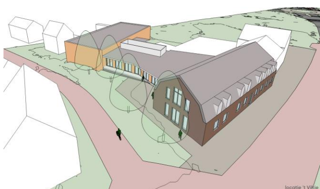
Locatie 't Viltje - scenario 1a - basis