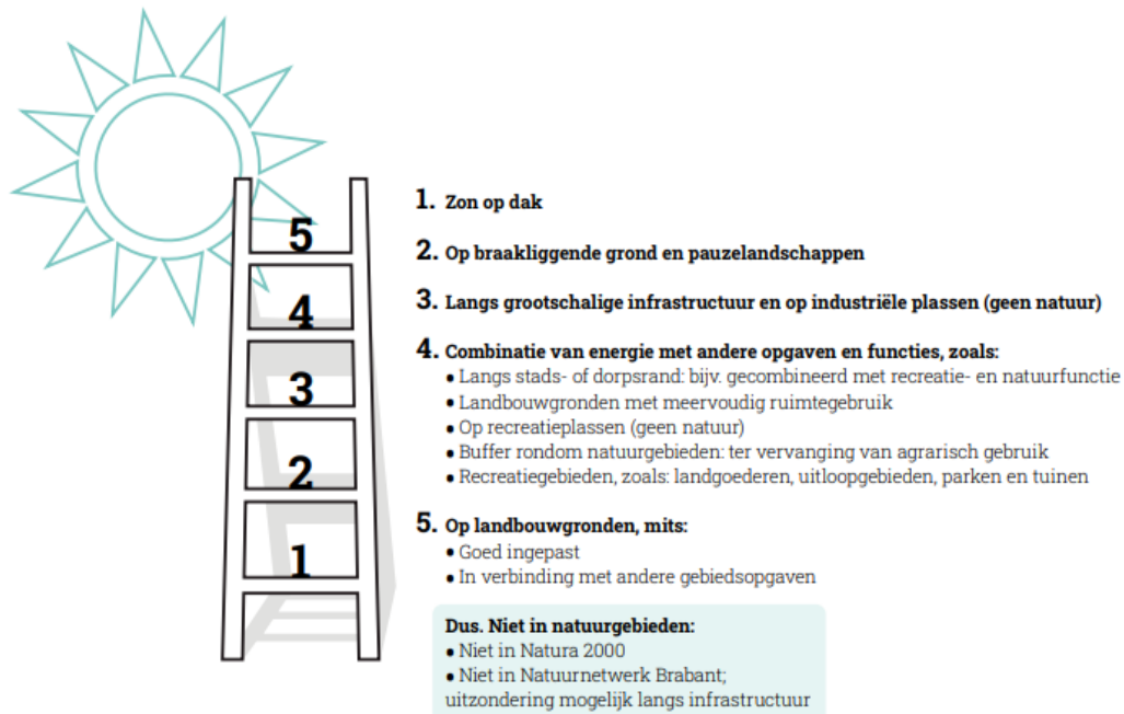
Afbeelding 1. Zonneladder Metropoolregio Eindhoven

We hebben in de concept-RES een zonneladder opgenomen die we in de zoektocht naar zoekgebieden voor zon gehanteerd hebben. Een uitgangspunt bij de zonneladder is zo veel mogelijk meervoudig ruimtegebruik. In het hoofdstuk grootschalige opwek van de concept RES 1.0 hebben we de zonneladder uit de concept-RES nader uitgewerkt, zie hiervoor ook onderstaande afbeelding.