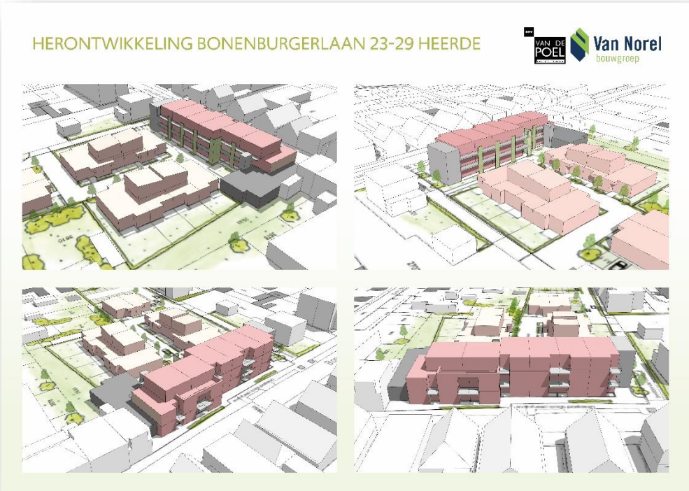
3D impressie nieuwe situatie